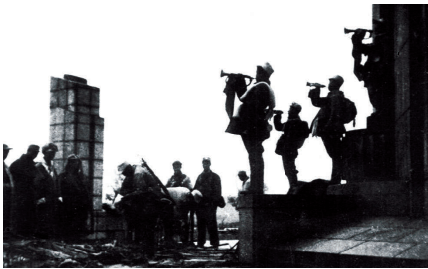
长春和平解放后，我军在市中心广场吹起胜利号角。

在吉林省长春市南湖公园北门入口处，矗立着一座造型简洁的纪念碑——长春解放纪念碑。纪念碑碑身背面刻着：“向为解放长春英勇献身的革命烈士表示深切的悼念，向为解放长春、建设长春做出贡献的人们致以崇高的敬意。”一座碑一句话，既承载着苦难的解放历史，也承载着辉煌的城市变迁。