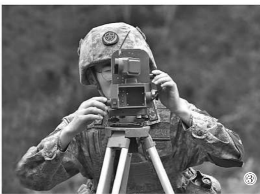
图③：甘肃省天水市清水县民兵进行地面气象观测训练。