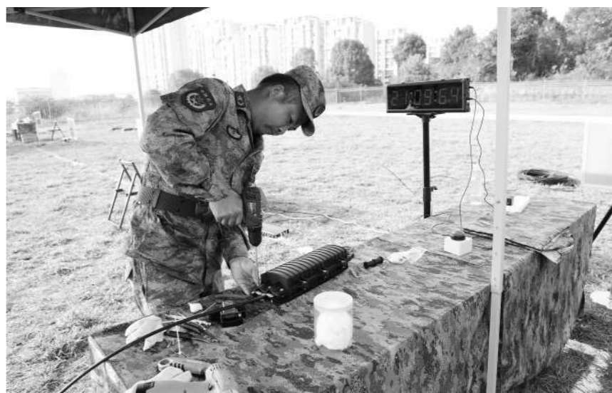
湖南省军区组织民兵通信线路抢修课目比武。

事训练的弱项。近年来，该省军区瞄准制约联训联演的深层次矛盾问题，着力打通军地壁垒，健全联训联战联保机制，完善预征预储制度，强化与对口支援保障部队的联合训练、挂钩训练、跟训帮训。 融入联合作战体系，不仅需要民兵有“联”的意识、“联”的行动，还需要做好顶层设计、统一规划。绘制后备力量建设蓝图，建立军地联合指挥机构，完善有关政策法规……近年来，省军区系统推动民兵体系建设、融合发展、联合制胜，加