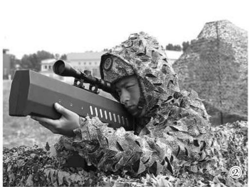
图②：河南省郑州警备区组织民兵进行反无人机训练。