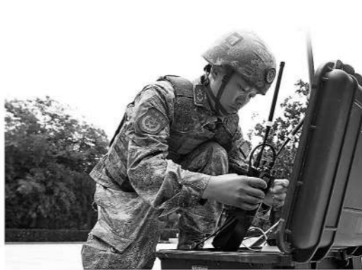
图④：安徽省宿州市灵璧县民兵开展应急通信保障训练。

持续的真抓实干让训练形势发生扭转，民兵建设加快由“实起来”向“好起来”“强起来”转变。如今，重复编兵等问题得到有效整改，民兵基础训练质效稳步提升，民兵基地化轮训路子越走越宽，训练保障、督察问责、奖惩激励等机制更加健全。