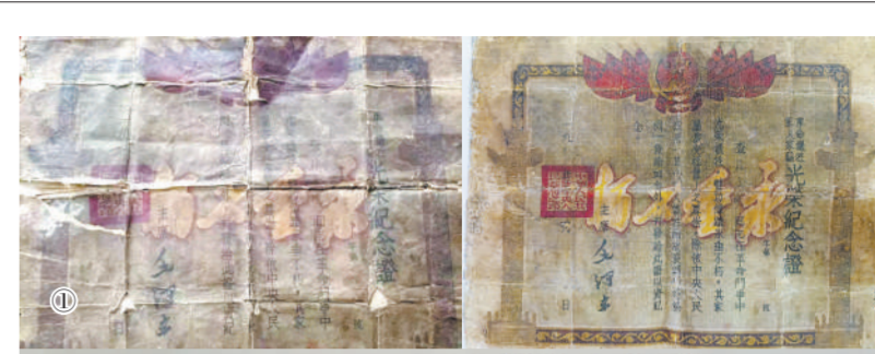
烈士们的功绩彪炳千秋 烈士们的英名万古流芳

队”矩阵，有力推动学校国防教育的深入开展。“一锤接着—锤敲，一环扣着一环扣。”高唐县人武部领导告诉笔者，在创建“英雄中队”深入推进校园国防教育的同时，县委宣传部会同县人武部对全县新招录的公务员、事业编人员，进行国防教育初任培训和岗前培训，每年分期分批组织40岁以下的中青年干部到民兵训练基地，参加不少于3天时间的军事训练。通过抓好中小学生和中青年干部的国防教育，有效带动和促进了全民国防教育的落地落实。