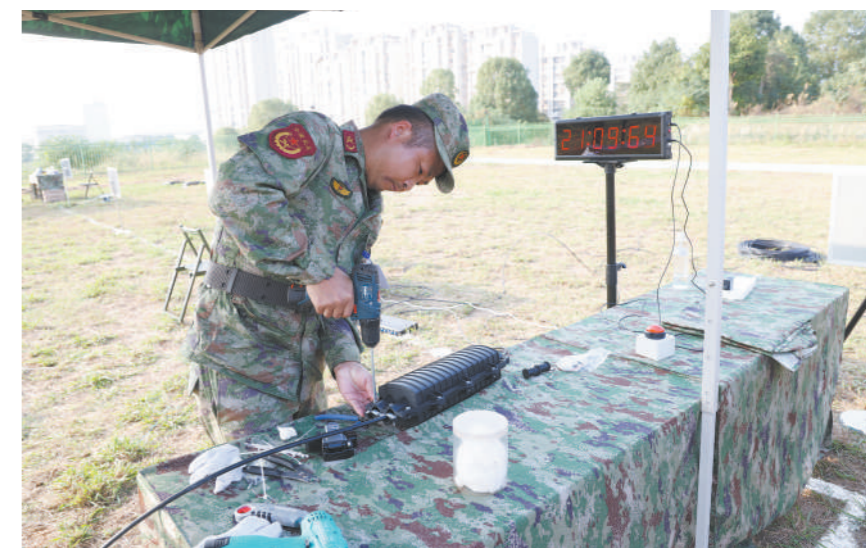
湖南省军区组织民兵通信链路抢修课目比武。