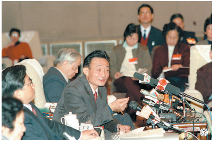
图⑤：1994年3月，时任上海市委书记的吴邦国同志在全国两会上海代表团全团会议上。