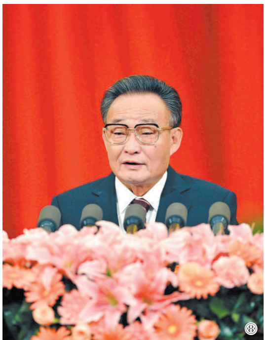
图⑧：二〇一一年三月十日，十一届全国人大四次会议在北京人民大会堂举行第二次全体会议。吴邦国同志作全国人民代表大会常务委员工作报告。