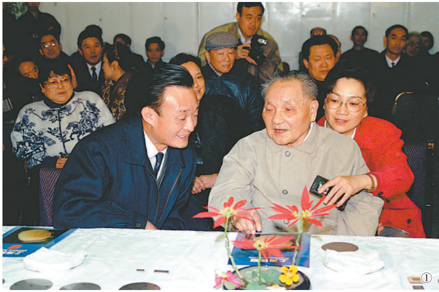
图①：1992年2月10日，邓小平同志在上海贝岭微电子制造有限公司参观时与吴邦国同志交谈。