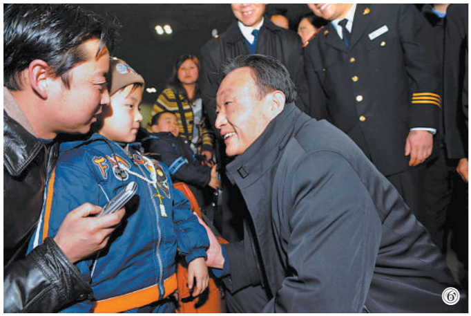
图⑥：2008年2月3日，吴邦国同志在北京西站候车室与旅客交谈。