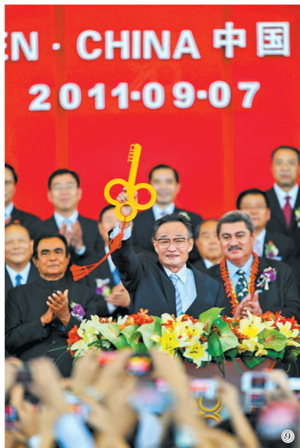
图⑨：二〇一一年九月七日，吴邦国同志在福建厦门出席第十五届中国国际投资贸易洽谈会开幕式。