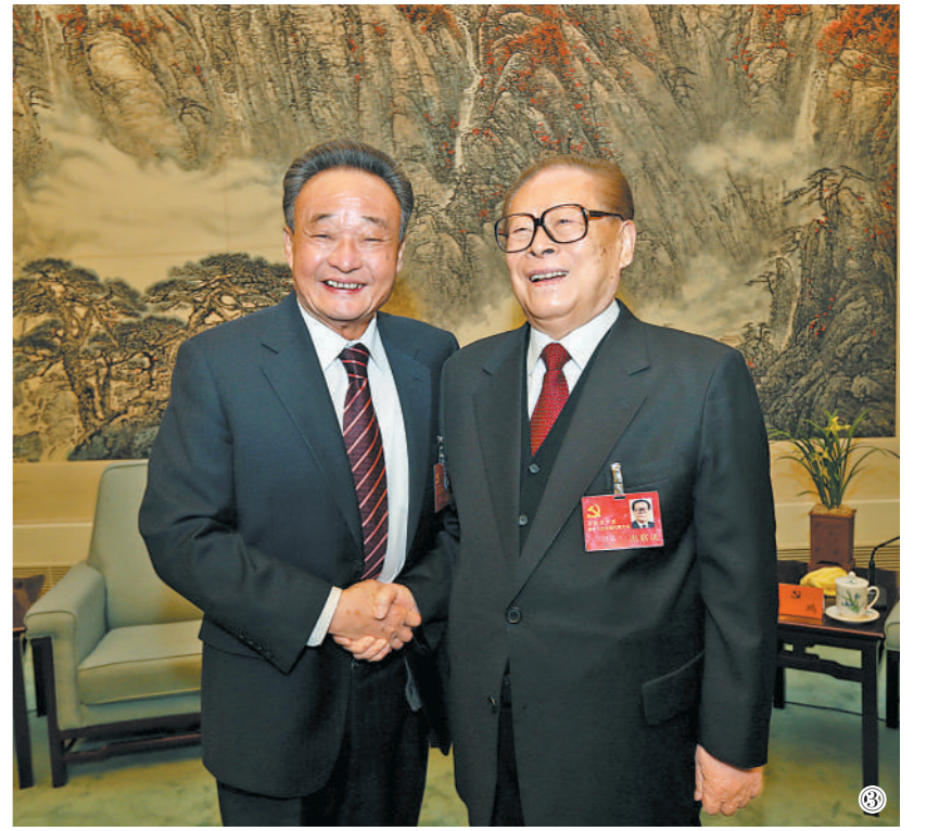
图③：2012年11月14日，中国共产党第十八次全国代表大会在北京闭幕。这是闭幕会前，江泽民同志与吴邦国同志在一起。