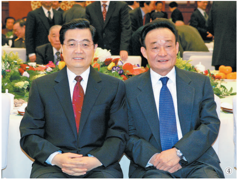
图④：二〇〇五年一月一日，全国政协在北京举行新年茶话会。这是胡锦涛同志与吴邦国同志在一起。