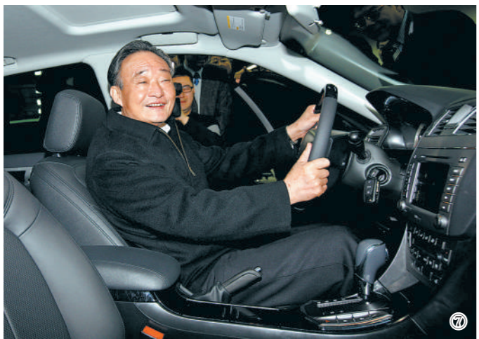
图⑦：2010年1月30日，吴邦国同志在上海汽车集团股份有限公司技术中心察看新能源车。