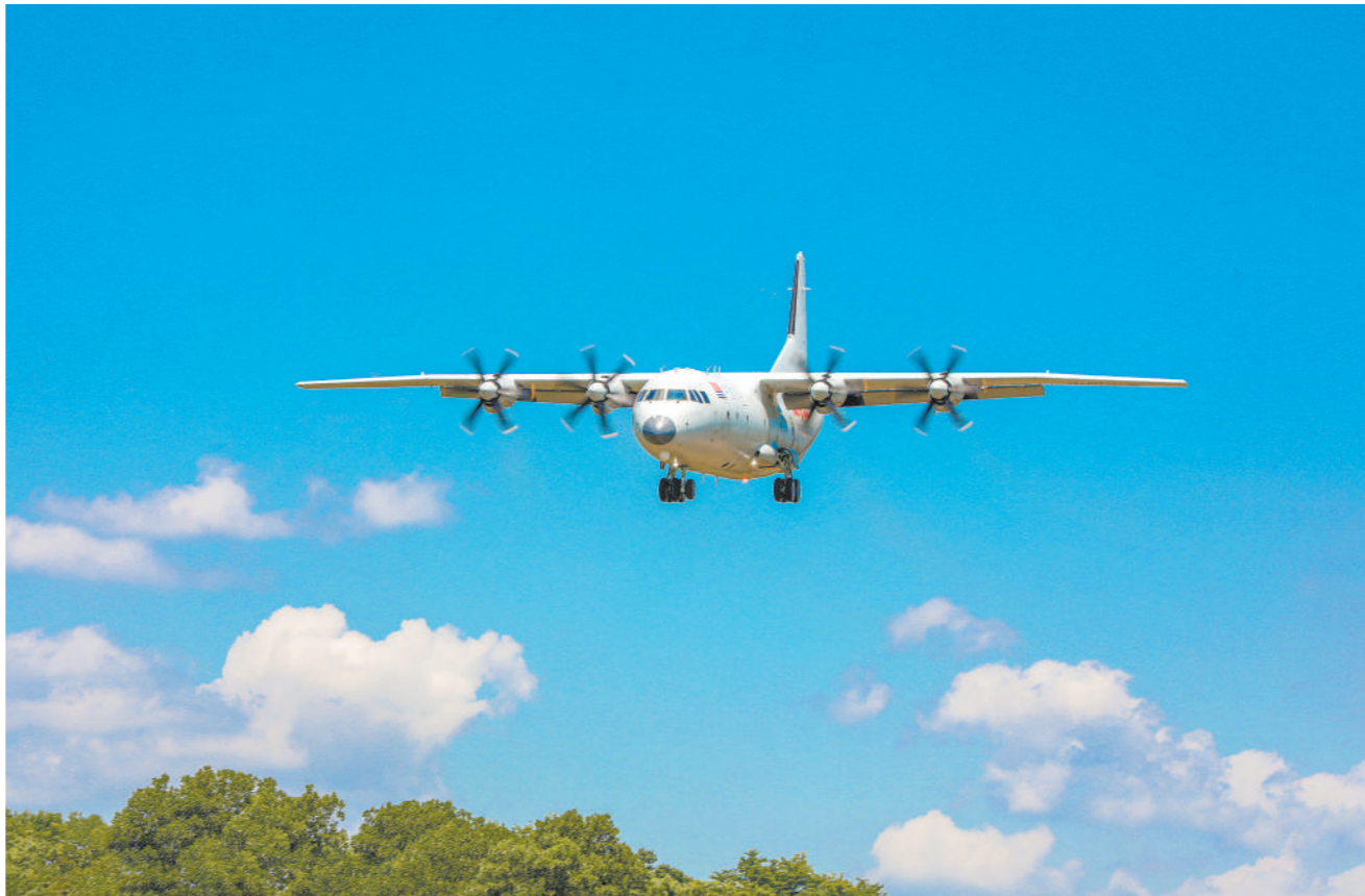
秋日,海军航空兵某团组织飞行训练。

合成训练重在练协同、协同练。合成训练以编组对抗为基本形式,以实现跨域联训为重点任务。开展合成训练,应遵循战斗力生成客观规律和合成训练本质要求,大胆创新合成训练组训方法;着眼联合作战能力需求和遂行多样化任务需要,打破军兵种力量建制,对作战力量进行科学优化与重组;采取仿真模拟、兵棋推演、实兵对抗、实弹检验等多种手段,全面提升部队的合成训练水平和实战能力,努力锻造能征善战的精兵劲旅。