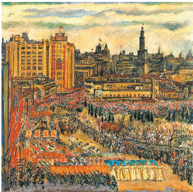
庆祝社会主义改造胜利(油画)