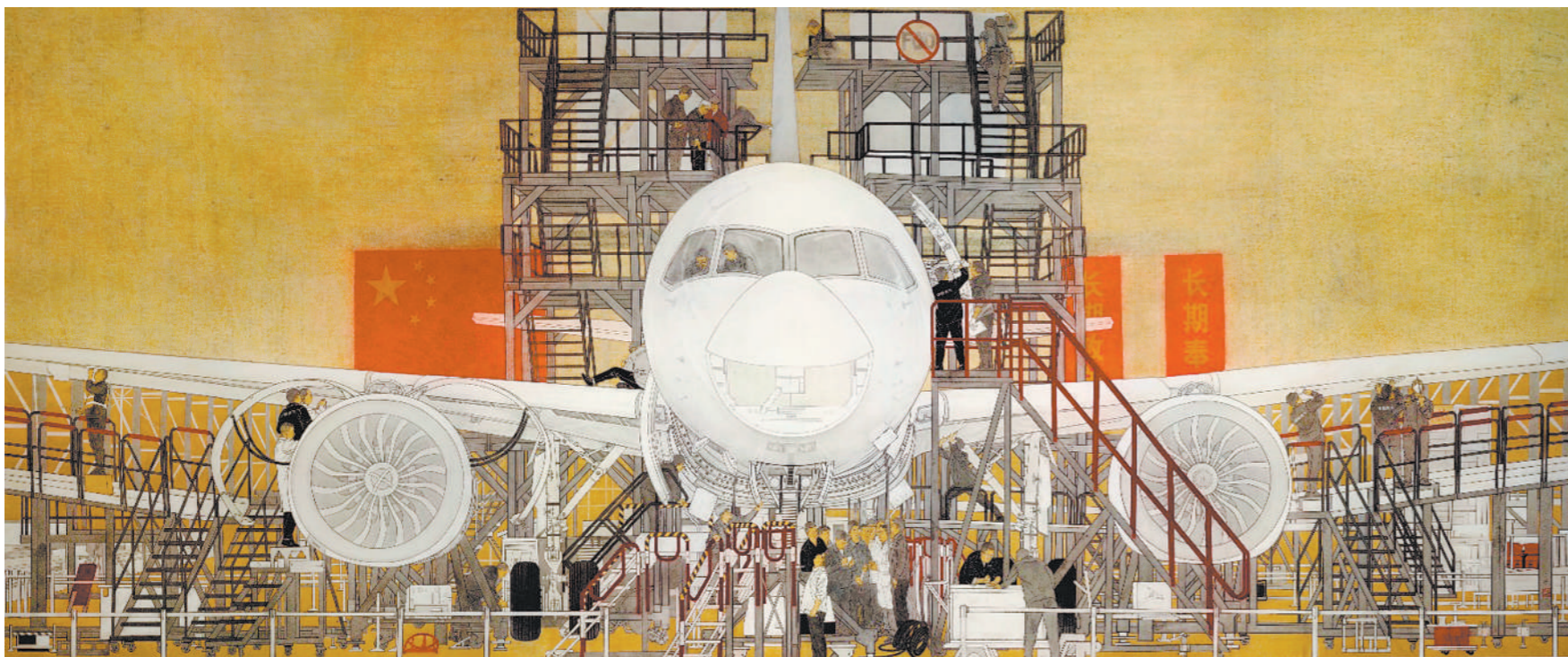
中国制造走向世界——C919大飞机(国画)