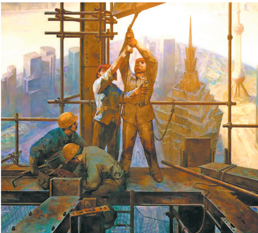
晨曲——浦东崛起(油画)