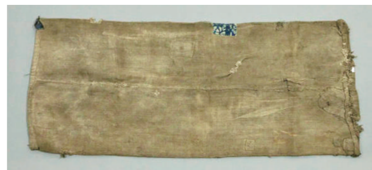
赵炳南使用的粮袋。

小小粮袋，装下的不仅是半袋高粱米，更是军民团结一心、勇往直前的信心和勇气。“革命战争是群众的战争，只有动员群众才能进行战争，只有依靠群众才能进行战争。”东北野战军严明的纪律建设所带来的良好形象和人民军队展现出的崇高品质、优良作风，赢得了广大人民群众的支持和信任。据不完全统计，在3年的东北解放战争中，东北广大人民群众共出动民工313万多人，担架20多万副，筹集粮食450万吨，160万优秀子弟参军参战，做到了解放军打到哪里、人民就支援到哪里，绘就了人民战争的宏伟画卷。