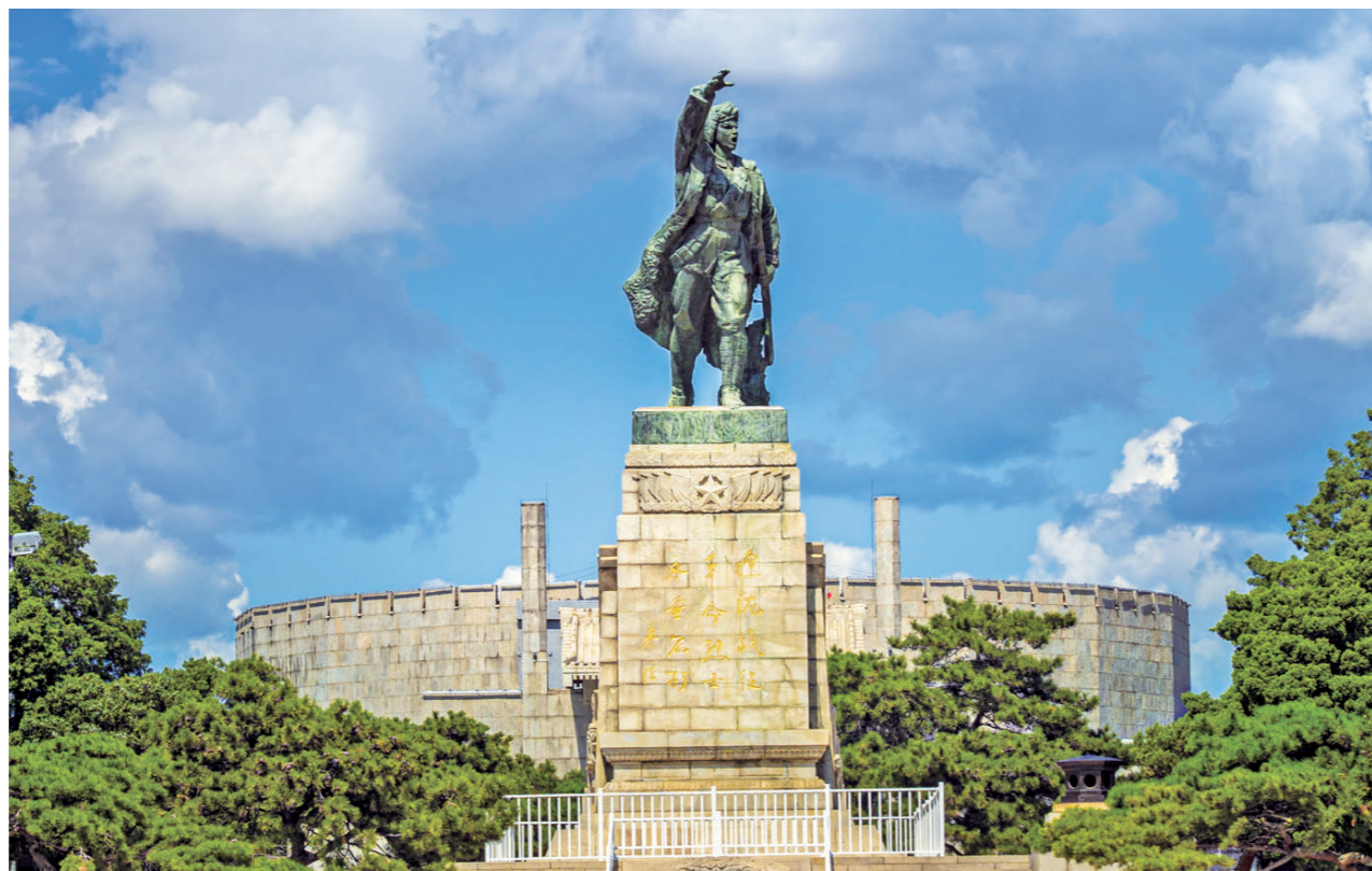
位于辽宁省锦州市的辽沈战役纪念馆。

1948年9月12日，震惊中外的辽沈战役在广阔的东北大地上打响。这是中国共产党领导的解放战争的首场战略决战，更是决定中国前途命运的“关键一战”。辽沈战役的胜利，不仅完成了党的七大时提出的“争取东北”的战略构想，使我党我军拥有了强大的战略后方，更是为之后的淮海和平津战役创造了有利条件，加速了全国解放战争的胜利进程，升起了新中国的第一缕曙光。