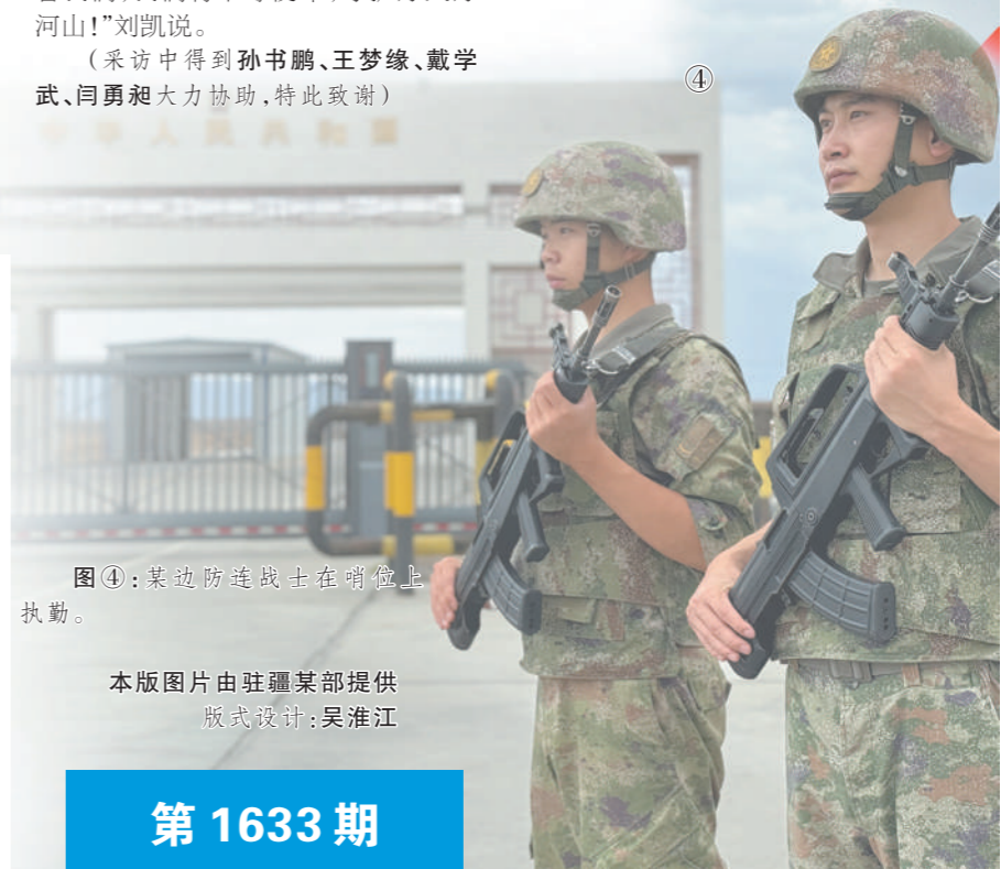
版式设计:吴淮江