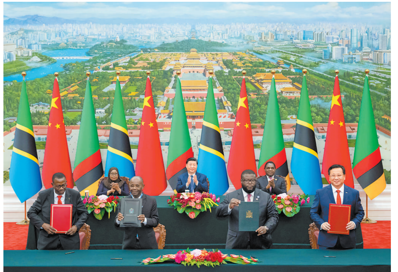
9月4日上午,国家主席习近平在北京人民大会堂同来华出席中非合作论坛北京峰会的坦桑尼亚总统哈桑、赞比亚总统希奇莱马共同见证签署《坦赞铁路激活项目谅解备忘录》。