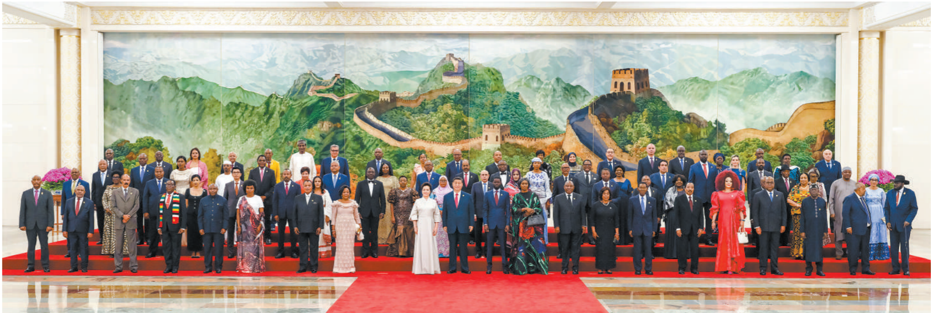
9月4日晚,国家主席习近平和夫人彭丽媛在北京人民大会堂举行宴会,欢迎来华出席中非合作论坛北京峰会的非方及国际贵宾。这是宴会前,习近平和彭丽媛同贵宾们集体合影留念。