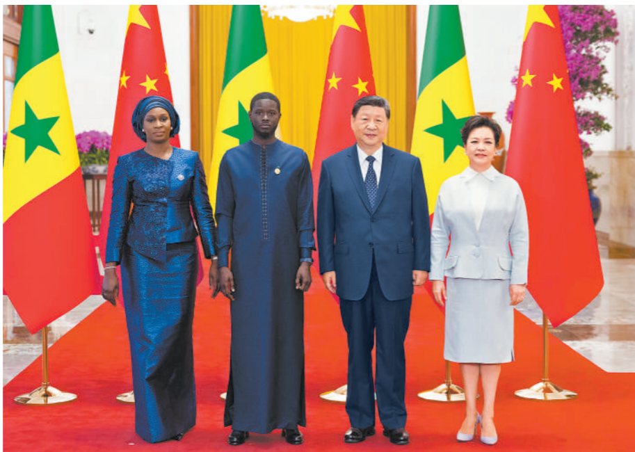
9月4日上午,国家主席习近平在北京人民大会堂同来华出席中非合作论坛北京峰会并进行国事访问的塞内加尔总统法耶举行会谈。会谈前,习近平在人民大会堂北大厅为法耶举行欢迎仪式。这是习近平和夫人彭丽媛同法耶和夫人玛丽合影。

法耶表示,我很荣幸来华进行首次国事访问并出席中非合作论坛北京峰会。感谢中方热情款待,使我们领略到中国的美丽与友好。塞中2016年建立全面战略合作伙伴关系以来,双方合作不断取得进展。塞中合作实施了很多成功项目,促进了塞内加尔经济发展和民生改善。(下转第三版)