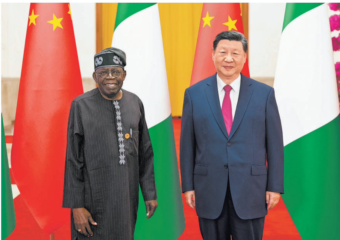
九月三日下午，国家主席习近平在北京人民大会堂同尼日利亚总统提努布举行会谈。这是会谈前，习近平在人民大会堂东大厅为提努布举行欢迎仪式。