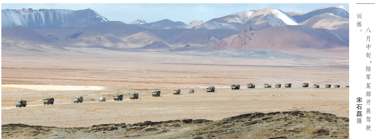
训练。八月中旬,陆军某部开展野营训练。

础中的基础,是中美关系第一条不可逾越的红线。中方始终致力于维护台海和平稳定,但“台独”同台海和平稳定水火不容。坚决反“独”促统是中国人民解放军的使命职责所系,对“台独”势力的肆意挑衅,我们必须予以反制。中方要求美方停止美台军事勾连,停止武装台湾,停止散布涉台虚假信息。 双方还就其他问题交换了意见。