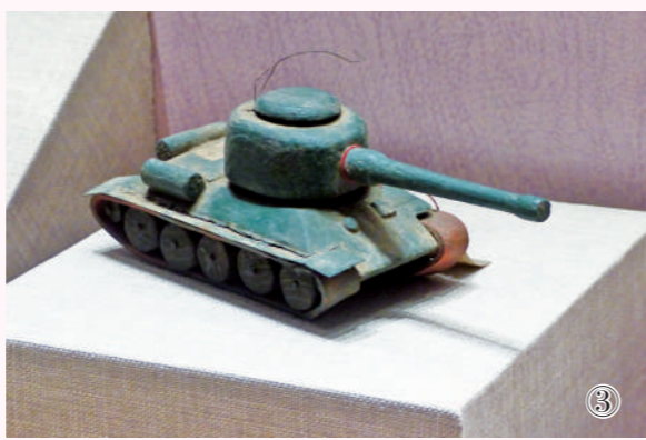
图2:“胜利的鼓舞者”——陕西历史博物馆馆藏抗美援朝文物展”序厅。