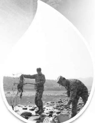
图③：十堰市房县民兵在辖区小流域清理垃圾。