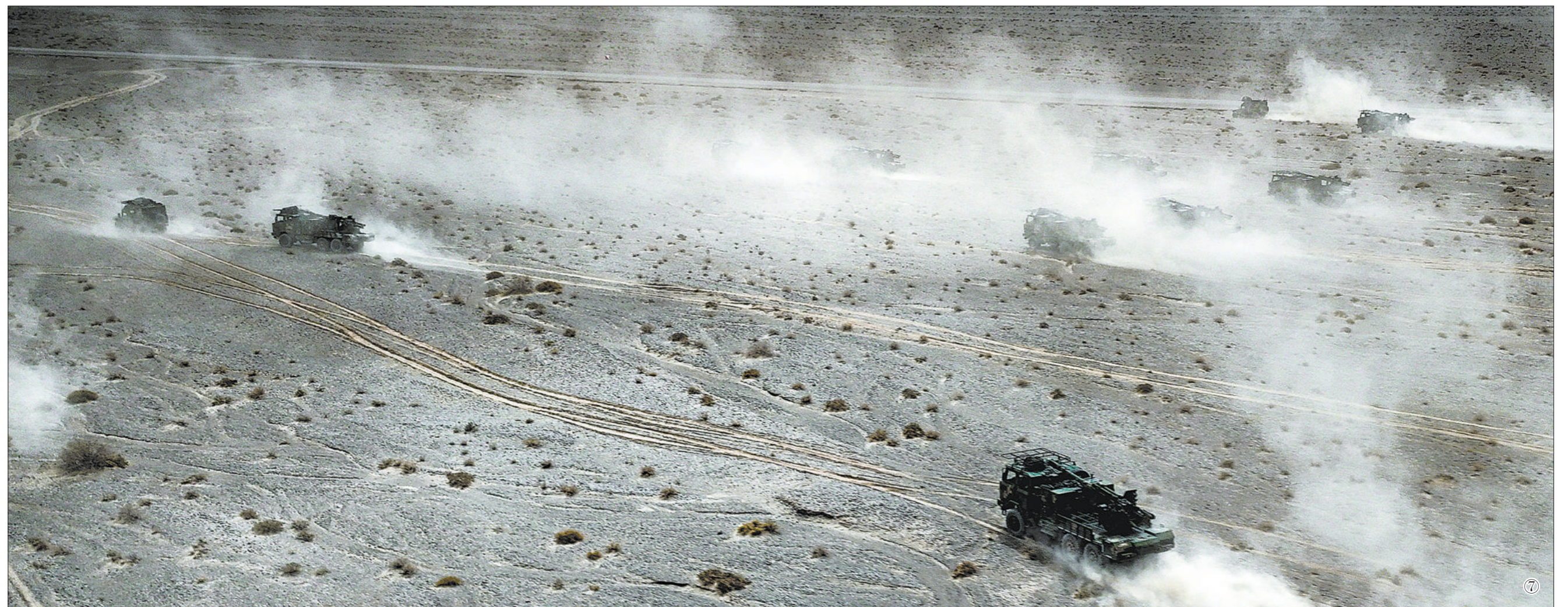
图①：官兵紧急出动开展防空训练。 图②：官兵对装备实施伪装。 图③：远火分队集火打击“敌”目标。 图④：发射导弹抗击来袭“敌机”。 图⑤：高炮夜间射击训练。 图⑥：直升机进行低空突防训练。 图⑦：向目标地域快速机动。