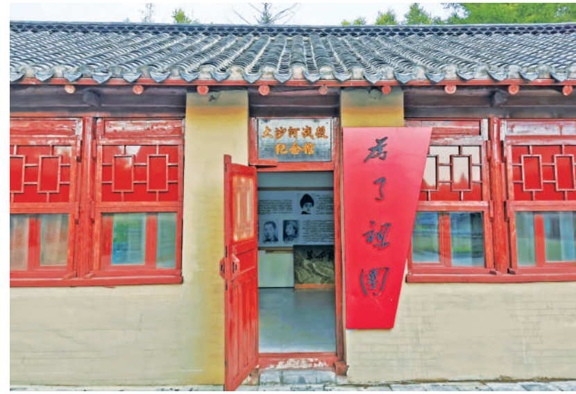
位于吉林省安图县的大沙河战役纪念馆。

得到上级指示后，第三方面军果敢执行命令，但在进军途中，因叛徒告密使安图县守敌加强了防范，攻打安图县的战斗计划只得取消。面对这种情况，魏拯民、陈翰章和侯国忠等经过审慎研究，重新制订了“攻城打援”的战斗方