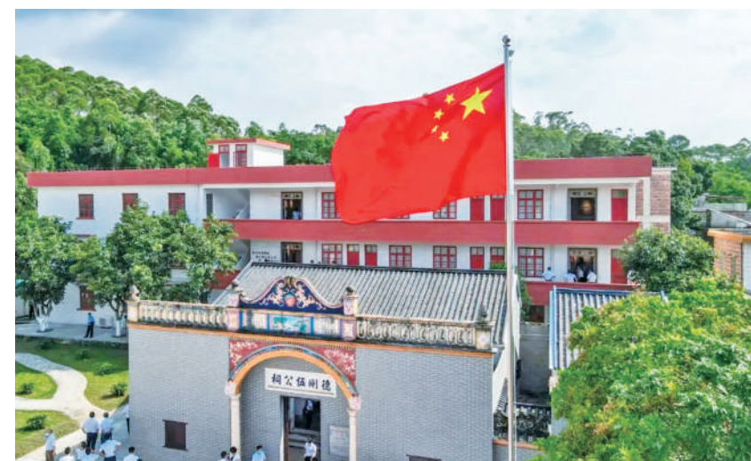
广东省肇庆市鳌头村抗日自卫队成立旧址。

石壁岭战斗在情报的助力下，可谓战果斐然。此战，游击队共歼灭敌军1个中队、俘敌56人，缴获了大批军需物资，沉重打击了反动派势力。