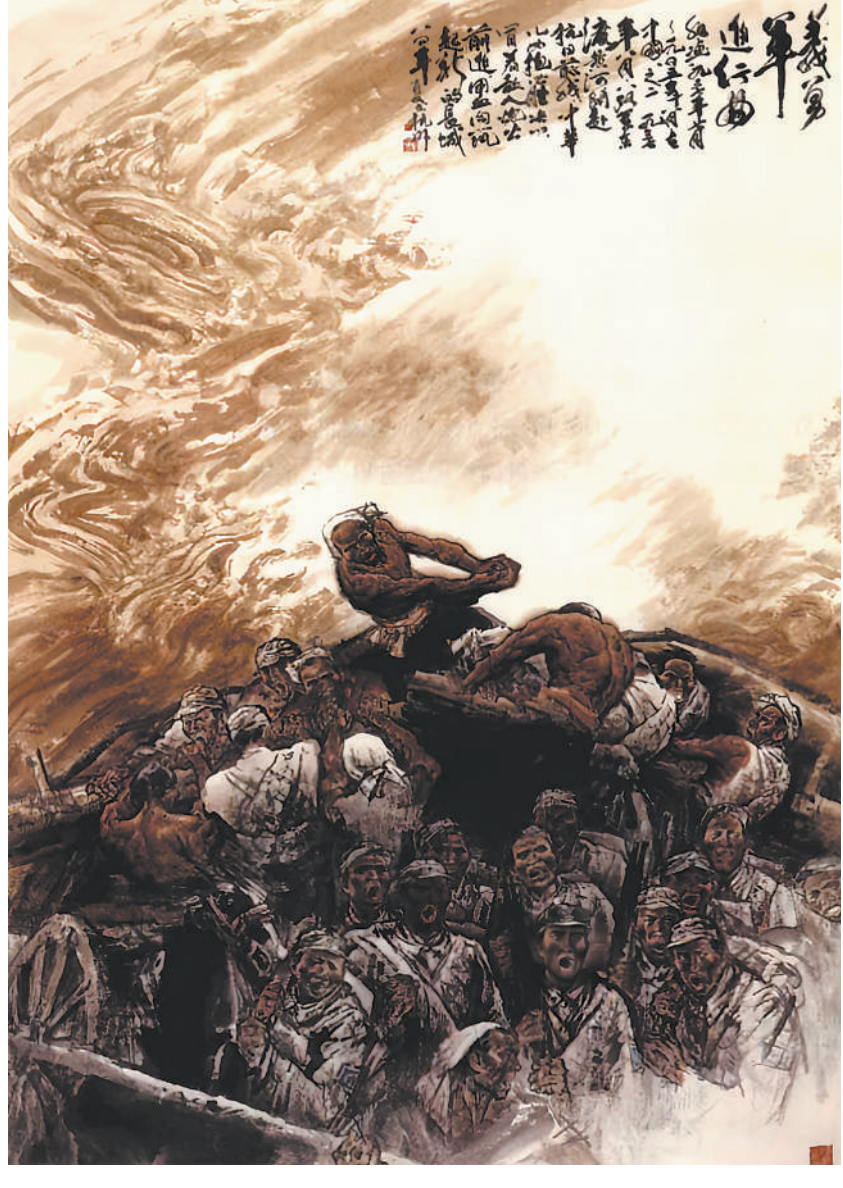
视觉阅读 保卫黄河——义勇军进行曲(中国画) 画家冯远于1984年创作的中国画《保卫黄河——义勇军进行曲》，描绘了八路军东渡黄河开赴抗日前线的场景，以黄河波涛汹涌的气势为烘托，展现出先辈们英勇顽强、不屈不挠的英雄形象。作品曾在“日出东方——上海市庆祝中国共产党成立100周年美术作品展”中展出。