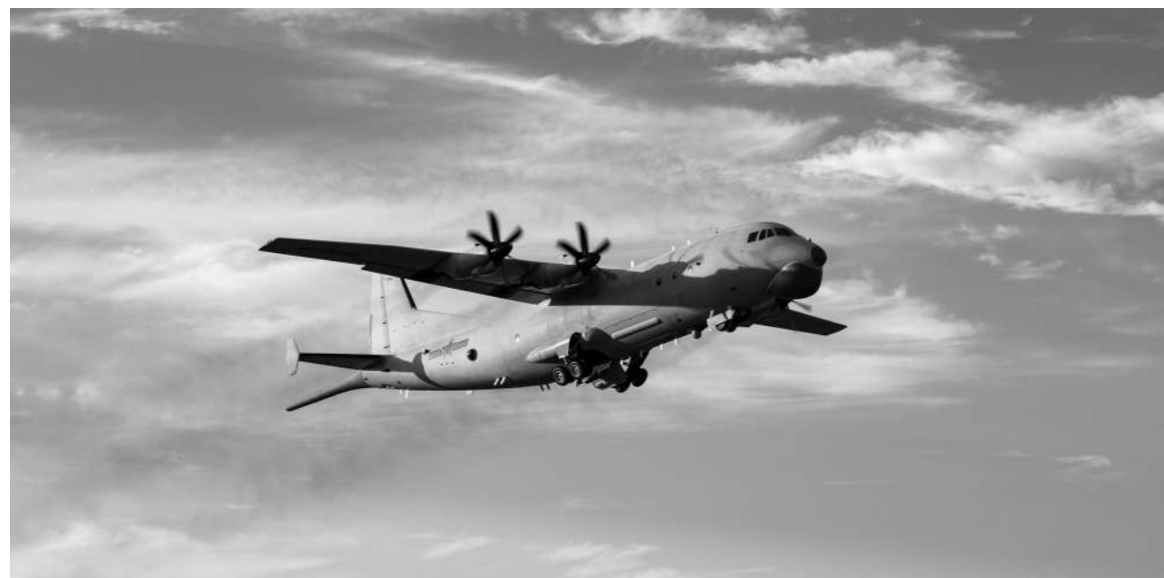
前不久，海军航空兵某团组织开展专攻精练。图为架战机飞赴训练空域。