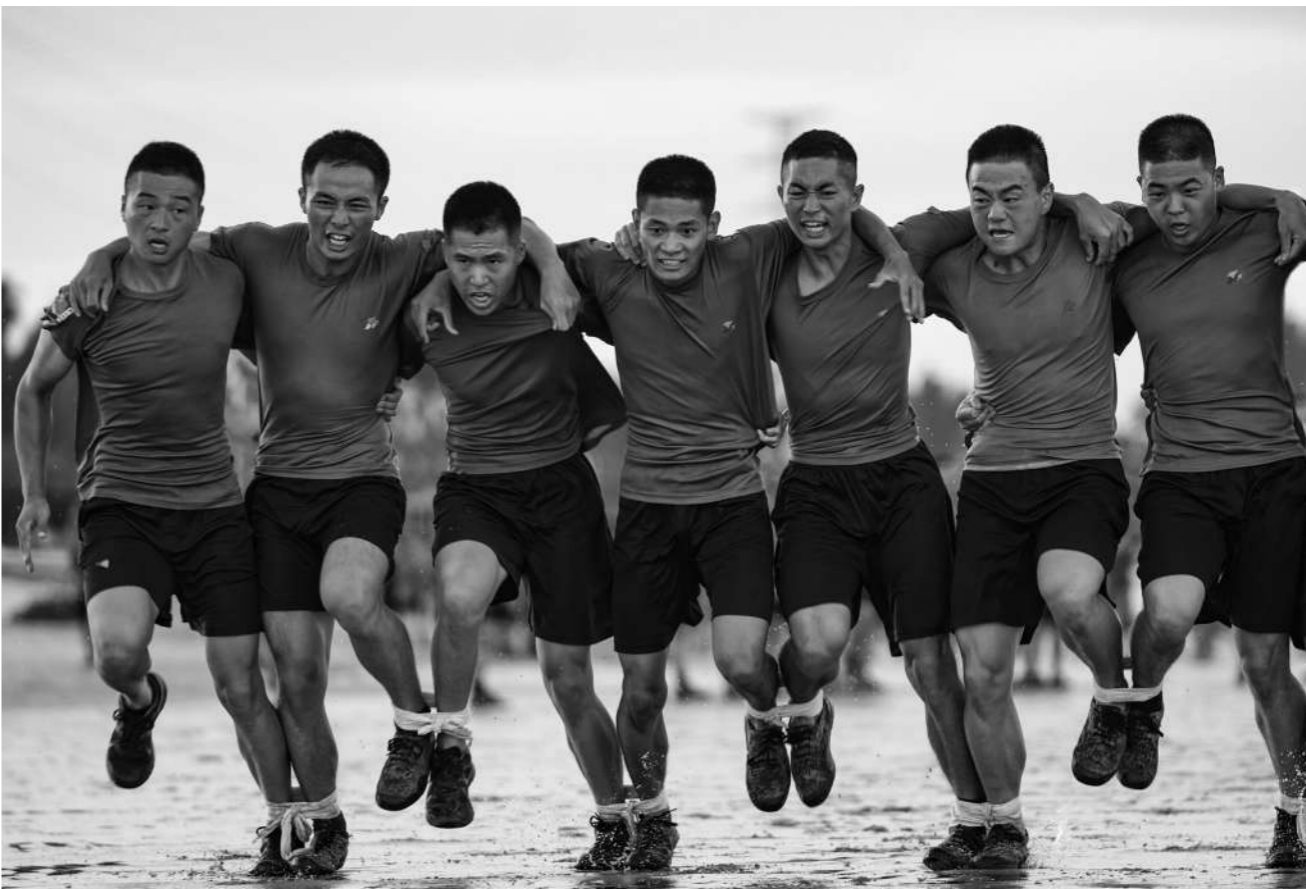
7月下旬，陆军某旅举办沙滩趣味运动会，丰富官兵海训生活。图为官兵进行“齐心协力”比赛。

据了解，下一步，该连还将持续营造比学赶超的学习训练氛围，既利用好老兵们的优秀经验，又让更多“新面孔”闯出自己的一片天地。