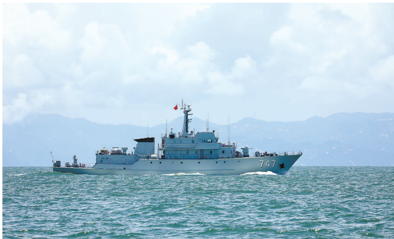
夏日,海军某大队开展海上多科目训练。

记者从南疆军区机关了解到,下一步,他们将按照“师对县、团对乡、营对村”思路开展双拥共建,持续推进“名企进乡村”等专项行动,不断巩固和发展军民鱼水情深、合力兴边富民新篇章。