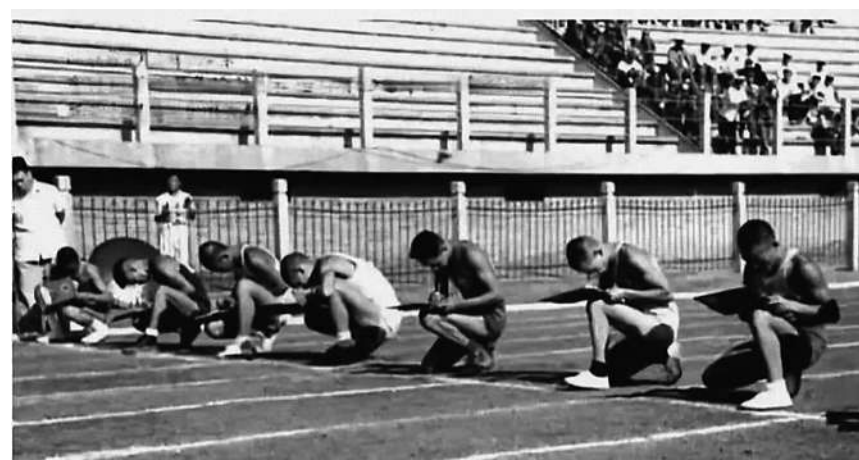
1952年8月,在第一届全军体育运动大会上,运动员正在进行写字赛跑比赛。资料图片

这次运动会取得了圆满成功,对推动部队更广泛、更深入地开展文化、体育活动,起了很大的作用。