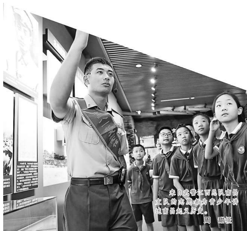
来自武警江西总队南昌支队的志愿者们为青少年讲解南昌起义历史。

目前，该团队共有成员222人，但仍沿用“百人团”的名字，这和成立时间有关。2021年，中国共产党成立100周年，全国掀起党史军史学习热潮，南昌成为旅游研学热门目的地，到南昌八一起义纪念馆参观的游客络绎不绝。为了满足线上线下讲解需求，该馆计划向