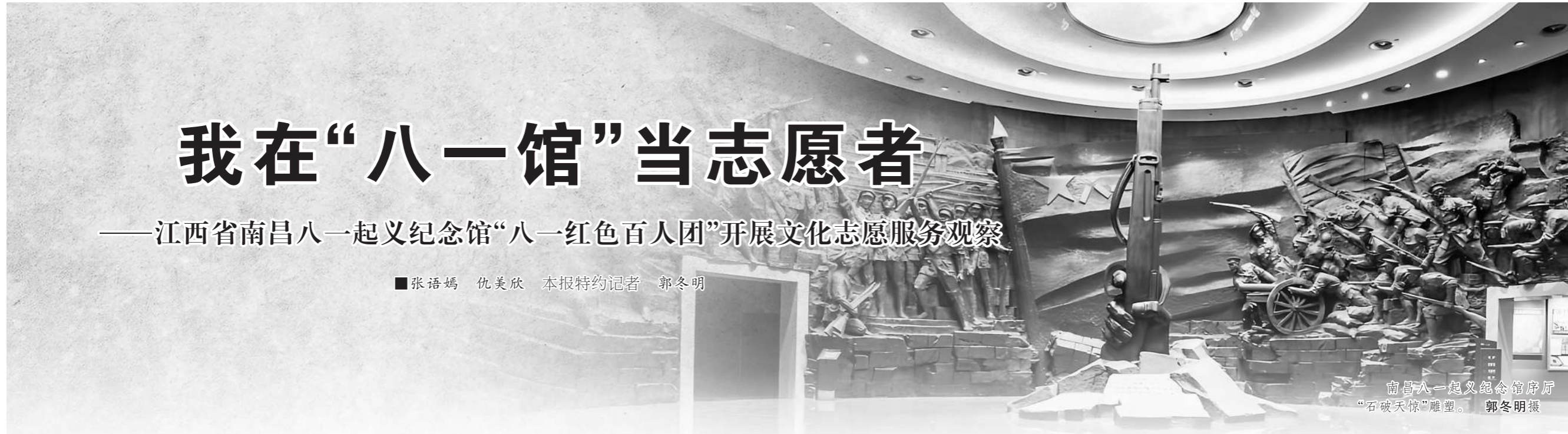
南昌八一起义纪念馆序厅“石破天惊”雕塑。

“八一大天亮，百姓早起床。昨夜晚，机关枪，其格格格格响，它是为哪桩……”“八一”前夕，位于江西省南昌市中山路380号的南昌八一起义纪念馆内，人头攒动，讲解员曹语嫣用南昌方言唱起《八一起义歌》，赢得现场阵阵掌声。