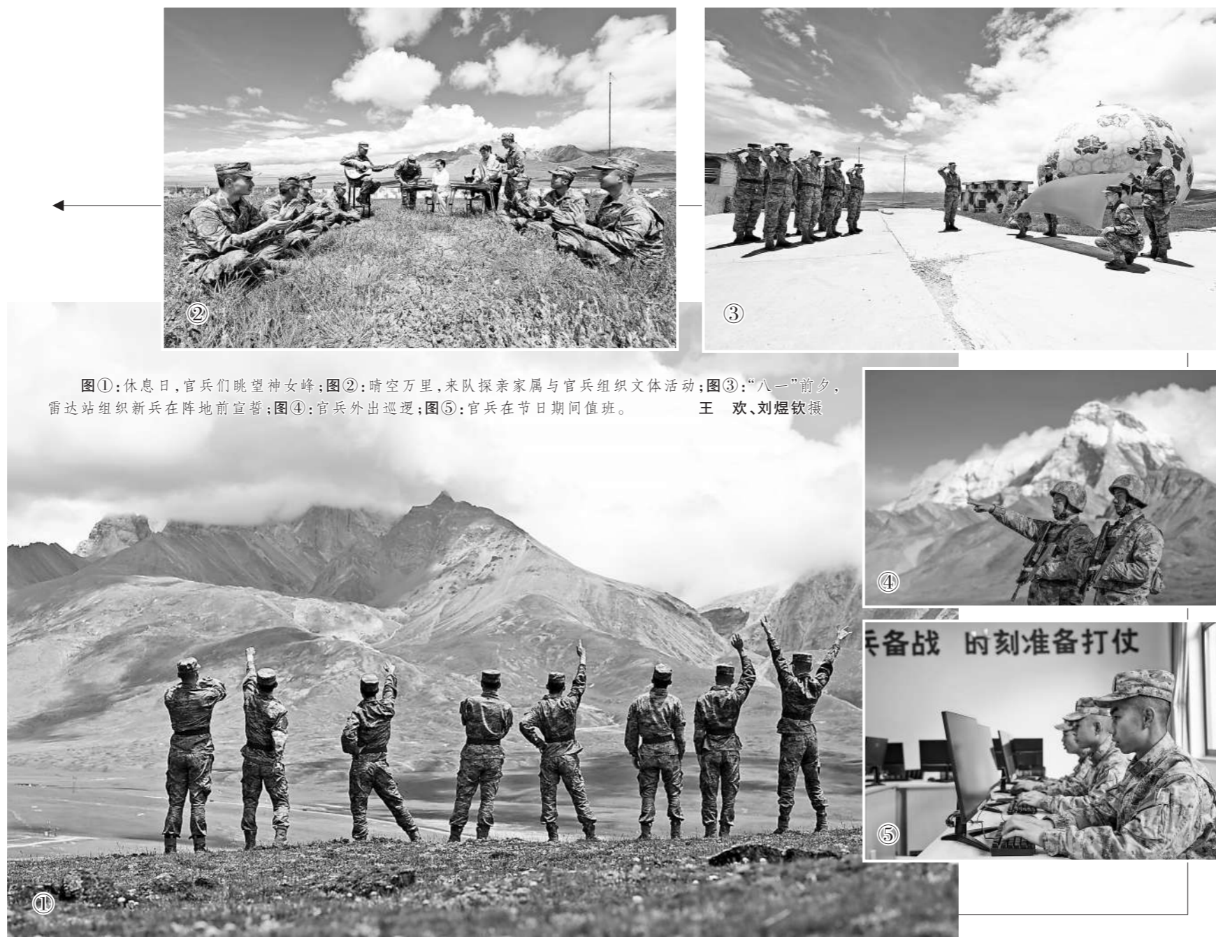
图①:休息日,官兵们眺望神女峰;图②:晴空万里,来队探亲家属与官兵组织文体活动;图③:“八一”前夕,雷达站组织新兵在阵地前宣誓;图④:官兵外出巡逻;图⑤:官兵在节日期间值班。