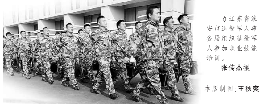
江苏省淮安市退役军人事务局组织退役军人参加职业技能培训。