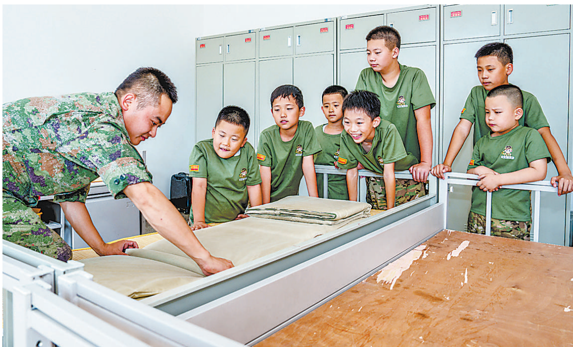
近日，新疆军区某团组织驻地青少年参加“童心筑梦小兵成长”主题夏令营活动。