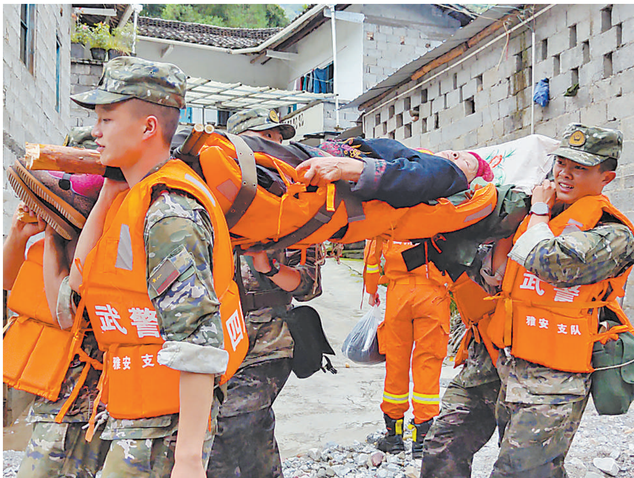
7月21日，在四川省雅安市汉源县马烈乡新华村，武警四川总队雅安支队官兵转移受灾群众。