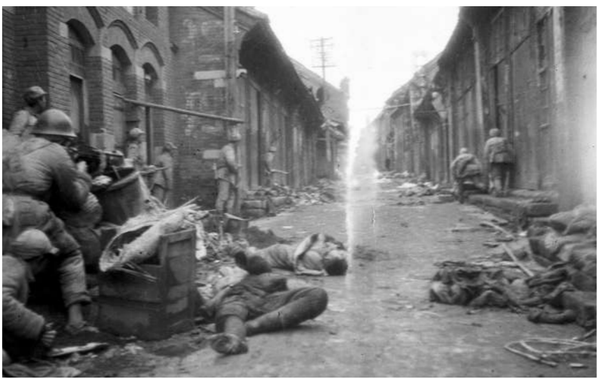
1948年3月,我军在淄川城内与国民党军进行巷战。

攻打敌人的主要据点,按常规是先打外围,层层剥皮,逐次攻击。但在周村战役发起前,第9纵队司令员聂凤智依据对敌情的周密侦察和分析判断,最终决定采取“挖心战术”,即远途奔袭,直取