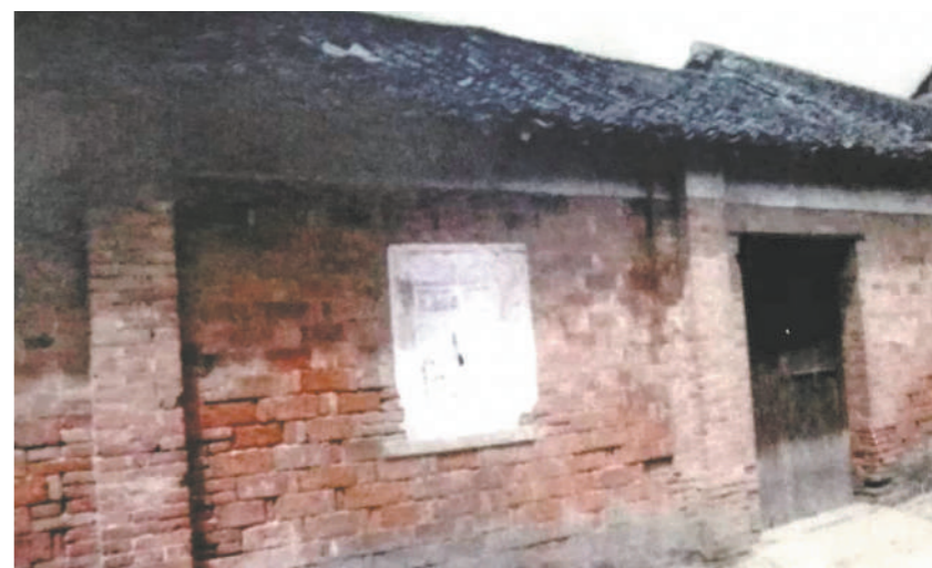
1942年,苏南抗日根据地成立的首家银行——惠农银行旧址。

苏南抗日根据地的举措,有力抗击了日伪货币的入侵,在一定程度上打破了经济封锁,稳定了根据地市场。