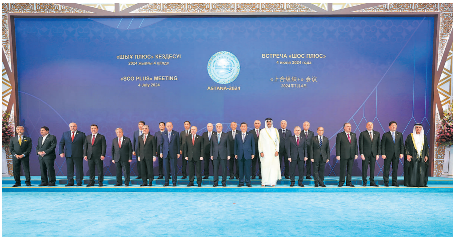
当地时间7月4日下午,国家主席习近平在阿斯塔纳出席“上海合作组织+”阿斯塔纳峰会并发表题为《携手构建更加美好的上海合作组织家园》的重要讲话。