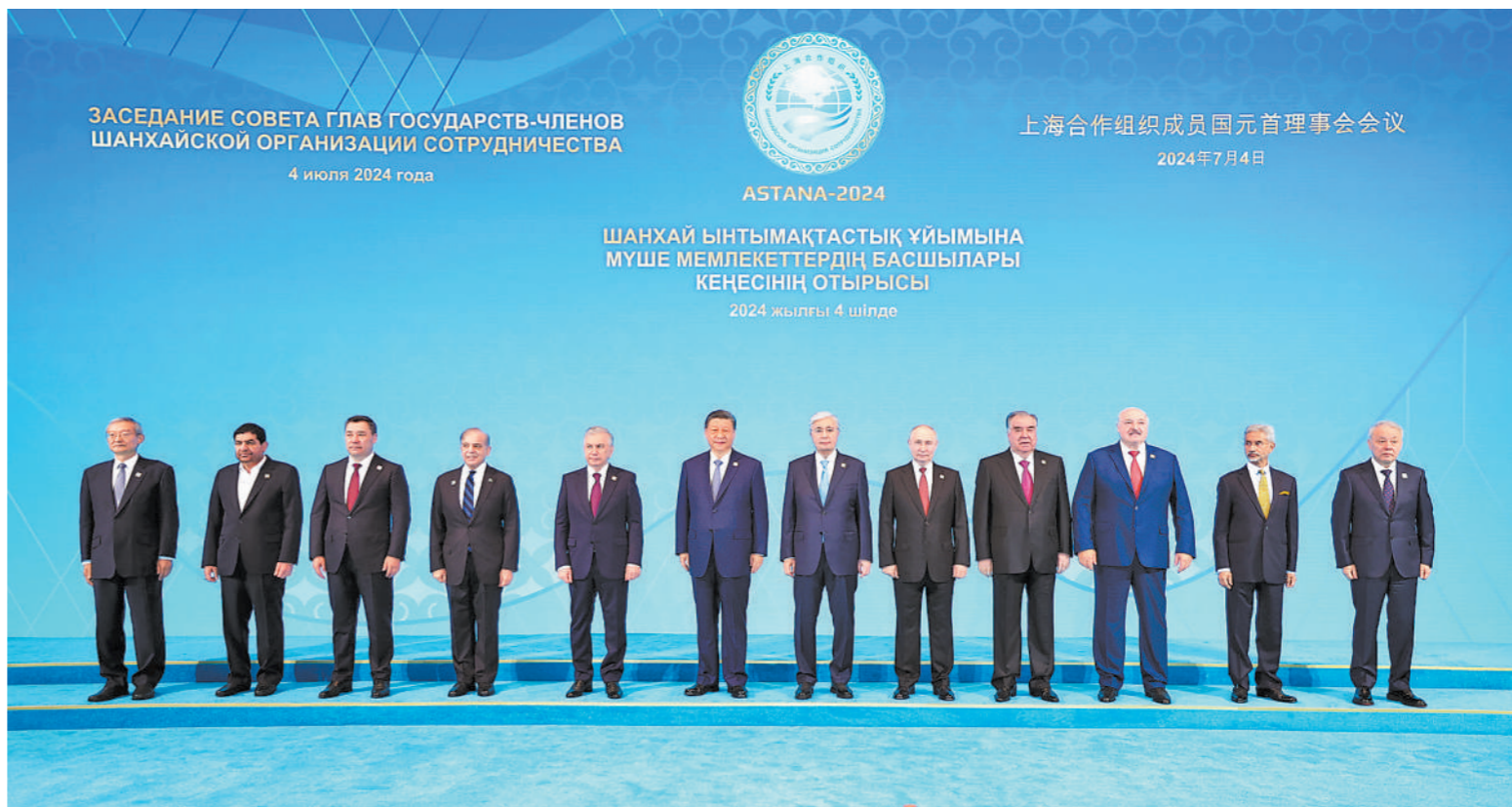
当地时间7月4日上午,国家主席习近平在阿斯塔纳独立官出席上海合作组织成员国元首理事会第二十四次会议。