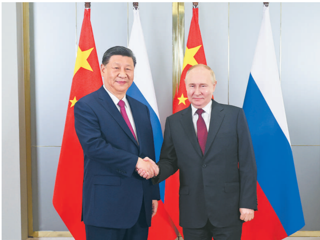
当地时间7月3日晚,国家主席习近平在阿斯塔纳出席上海合作组织峰会前会见俄罗斯总统普京。

习近平强调,中俄要继续加强发展战略对接和国际战略协作。中方支持俄方履行好金砖国家轮值主席国职责,团结“全球南方”,防止“新冷战”,反对非法单边制裁和霸权主义。明天将举行上海合作组织阿斯塔纳峰会。中方期待同俄罗斯和各成员国一道,推动本组织发展行稳致远,打造更加紧密的上海合作组织命运