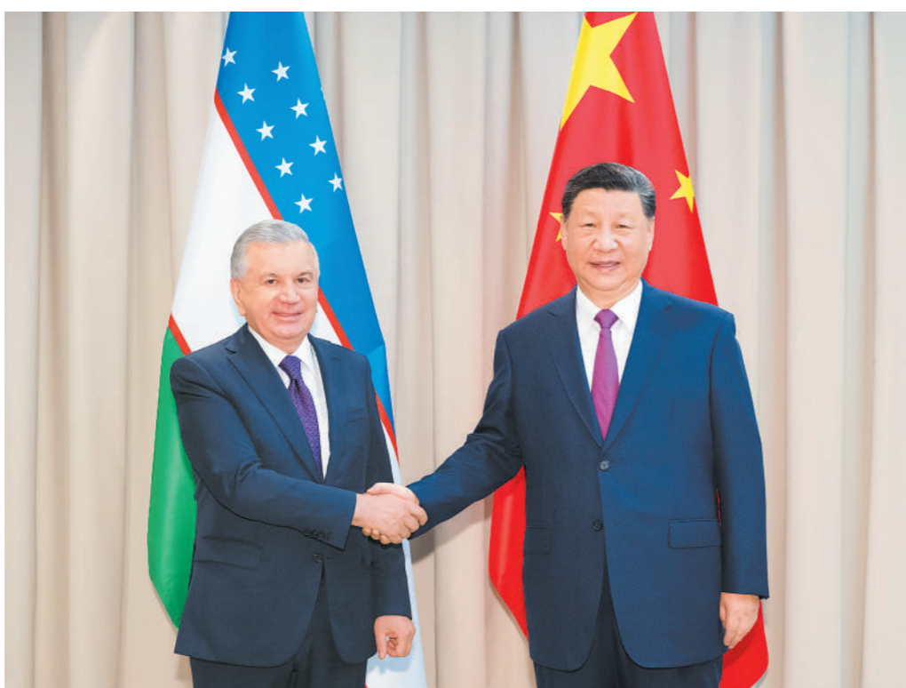
当地时间7月3日下午,国家主席习近平在阿斯塔纳出席上海合作组织峰会前会见乌兹别克斯坦总统米尔济约耶夫。

习近平强调,中方坚定支持乌兹别克斯坦维护国家独立、主权、安全,是乌方可以信赖的朋友和伙伴。双方要深入推进共建“一带一路”建设,落实经贸和投资中长期合作规划,加快中吉乌铁