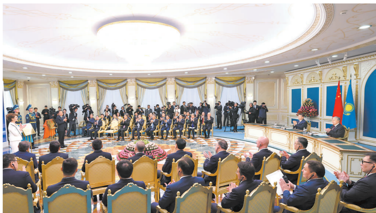
当地时间7月3日中午,国家主席习近平同哈萨克斯坦总统托卡耶夫在阿斯塔纳总统府共同出席阿斯塔纳中国文化中心、北京哈萨克斯坦文化中心和北京语言大学哈萨克斯坦分校揭牌仪式。