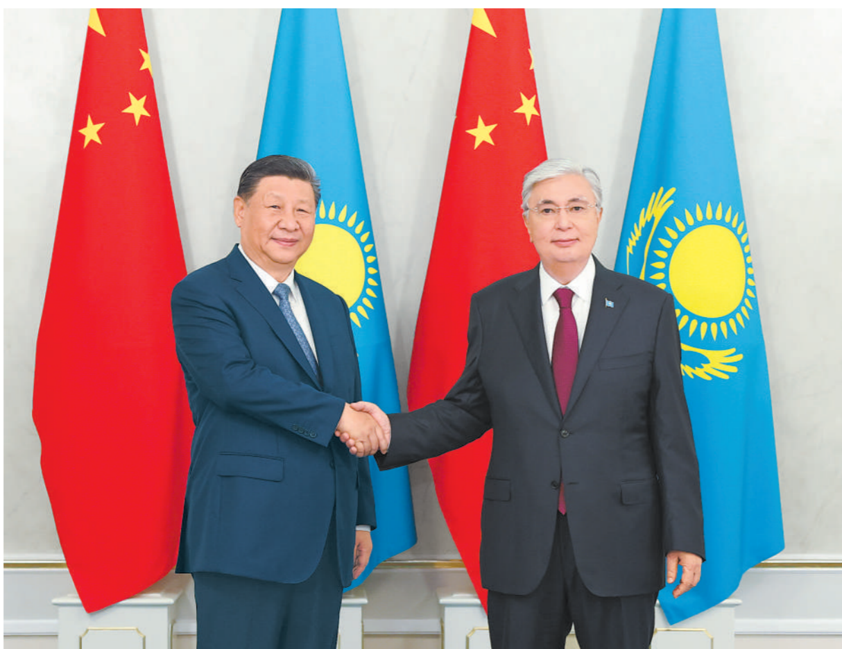
当地时间7月3日上午,国家主席习近平在阿斯塔纳总统府同哈萨克斯坦总统托卡耶夫举行会谈。这是习近平同托卡耶夫握手。