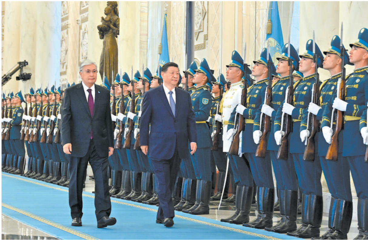
当地时间7月3日上午,国家主席习近平在阿斯塔纳总统府同哈萨克斯坦总统托卡耶夫举行会谈。托卡耶夫为习近平举行隆重欢迎仪式。这是习近平在托卡耶夫陪同下检阅仪仗队。

新华社阿斯塔纳7月3日电 (记者杨依军、鲁金博)当地时间7月3日中午,国家主席习近平在阿斯塔纳总统府同哈萨克斯坦总统托卡耶夫会谈后共同会见记者。 习近平指出,这是我第五次访问友好邻邦哈萨克斯坦,也是我同托卡耶夫总统时隔9个月再次会晤。刚才我同托卡耶夫总统举行了亲切友好、富有成果的会谈,达成广泛共识,共同签署了《中华人民共和国和哈萨克斯坦共和国联合声明》,共同规划两国未来合作重点方向,我们还见证交换了两国多项政府间、部门间合作文件,涉及经贸、互联互通、能源、农业、科技、人文等重点领域,为中哈关系高质量发展注入新动力。 习近平强调,中哈关系根植于绵延千年的古丝绸之路,又经过建交32年互利合作的积淀,已经达到永久全面战略伙伴关系的高水平,世代友好、高度互信、休戚与共成为中哈合作的主旋律。展望未来,我们对两国传统友好和全方位合作的传承和发展充满信心。 我们一致认为,中哈两国都处在各自发展振兴的关键阶段,是现代化道路上的同路人。双方将继续发扬相互支持的优良传统,持续深化政治互信,推进发展战略对接,坚定维护彼此核心利益,做对方可以倚重和信赖的坚强后盾。 (下转第二版)