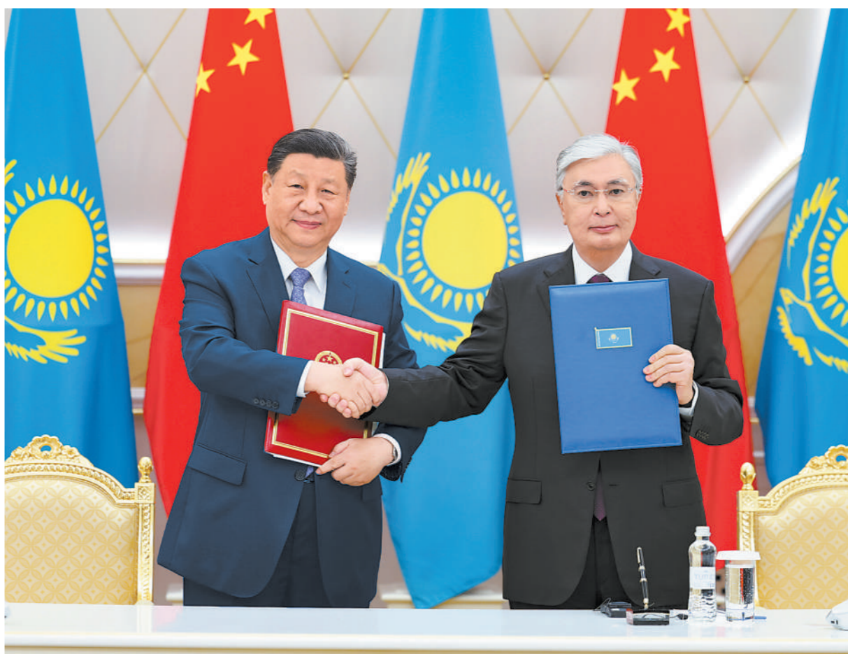
当地时间7月3日上午,国家主席习近平在阿斯塔纳总统府同哈萨克斯坦总统托卡耶夫举行会谈。会谈后,两国元首共同签署《中华人民共和国和哈萨克斯坦共和国联合声明》,并共同见证交换经贸、互联互通、航空航天、教育、媒体等领域数十项双边合作文件。

新华社阿斯塔纳7月3日电 (记者倪四义、胡晓光、张继业)当地时间7月3日上午,国家主席习近平在阿斯塔纳总统府同哈萨克斯坦总统托卡耶夫举行会谈。 习近平乘车抵达总统府时,托卡耶夫总统热情迎接。六架哈萨克斯坦空军战机从总统府上空飞过,拉出象征中国国旗的红黄色彩烟,以最高礼仪欢迎习近平对哈萨克斯坦进行国事访问。 托卡耶夫为习近平举行隆重欢迎仪式。 总统府大厅气势恢宏,礼兵威武挺拔。两国元首分别同对方陪同人员一一握手致意。两国元首登上检阅台,军乐团奏中哈两国国歌。习近平在托卡耶夫陪同下检阅仪仗队。 欢迎仪式后,两国元首举行小范围会谈。 习近平指出,去年,我和托卡耶夫总统在西安和北京两次会晤,就中哈关系发展作出新部署新规划,引领中哈关系“黄金30年”快速发展。中方始终从战略高度和长远角度看待中哈关系,将哈萨克斯坦视为中国周边外交的优先方向和在中亚的重要合作伙伴,中方维护好、发展好中哈关系的意愿和决心坚定不移,不会因一时一事或国际风云变幻而改变。中国将永远是哈方可以倚重和信赖的好邻居好伙伴。中方愿同哈方继续加强天然气等传统能源合作,拓展光伏、风电等新能源合作,支持更多中国企业赴哈萨克斯坦投资,助力哈方将资源优势转换为发展能力,实现绿色、低碳、可持续发展。 托卡耶夫表示,习近平主席对哈萨克斯坦进行国事访问对哈中关系发展具有历史性重大意义。中国是哈萨克斯坦的友好邻邦、亲密朋友和重要战略合作伙伴,哈中关系基于牢固的睦邻友好和坚定的相互支持,呈现出前所未有的良好发展势头,贸易、能源、农业、矿产等领域合作取得重要成果,造福了两国人民,堪称两国关系的典范。哈方祝贺中国取得的全方位历史性成就,相信在习近平主席英明领导下,中国在新时代中国特色社会主义道路上必将取得新的更大成就。哈方愿同中方一道,进一步挖掘两国在