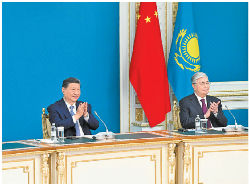
当地时间7月3日中午,国家主席习近平同哈萨克斯坦总统托卡耶夫在阿斯塔纳总统府以视频方式共同出席中欧跨里海直达快运开通仪式(拼版照片)。