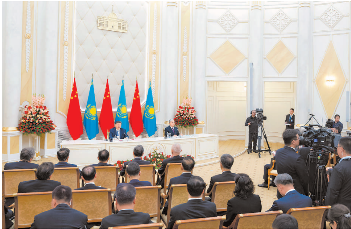
当地时间7月3日中午,国家主席习近平在阿斯塔纳总统府同哈萨克斯坦总统托卡耶夫会谈后共同会见记者。