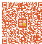
扫码观看电影《解放石家庄》精彩片段

《解放石家庄》海报以战士、硝烟、信号弹等元素展现鲜明的战斗气息，成为观众直观感受石家庄战役中解放军官兵英勇战斗风采的生动载体。为能准确鉴赏海报，笔者拜访了海报绘制者。身为八一电影制片厂的新一代美术工作者，听着老前辈娓娓道来的讲述，笔者忽而觉得：海报绘制过程何尝不是对历史和英雄的致敬与告慰？海报画面内外，军人的家国情怀与军影人的光影使命跨越时空，深沉交融。