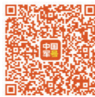
扫码观看纪录片《共和国符号》

共和国符号是中华人民共和国的象征，代表着国家权威与尊严，是中华民族共有精神标识，将中华儿女的心紧紧凝聚在一起。中华儿女自觉厚植家国情怀，把对祖国的自豪感、归属感，化作为祖国增光添彩的不懈动力，让共和国符号愈加熠熠生辉。