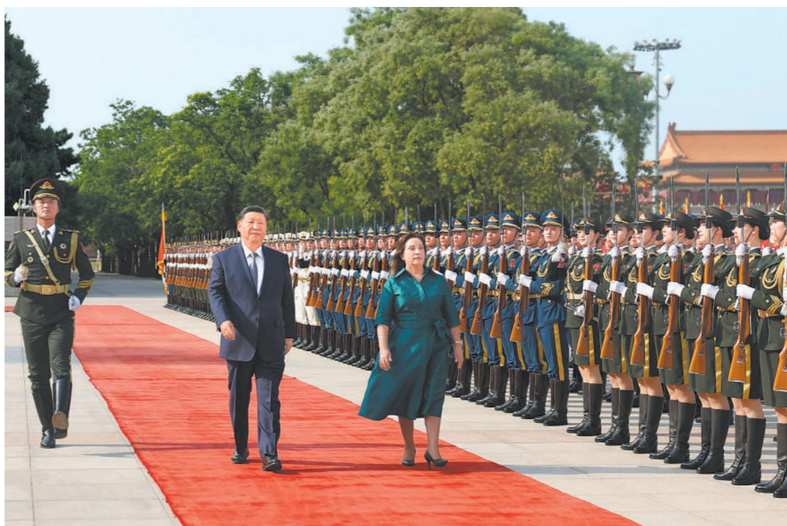
六月二十八日下午,国家主席习近平在北京人民大会堂同来华进行国事访问的秘鲁总统博鲁阿尔特举行会谈。这是会谈前,习近平在人民大会堂东门外广场为博鲁阿尔特举行欢迎仪式。

新华社北京6月28日电 (记者孙奕)6月28日下午,国家主席习近平在北京人民大会堂同来华进行国事访问的秘鲁总统博鲁阿尔特举行会谈。 习近平指出,中国和秘鲁都是文明古国,两国友谊源远流长,人民友好深入人心。秘鲁是最早同新中国建交、最早同中国建立全面战略伙伴关系的拉美国家之一,也是最早同中国签署一揽子自由贸易协定的拉美国家。近年来,在双方共同努力下,中秘各领域合作取得丰硕成果,中国企业在秘鲁重大合作项目为秘鲁经济发展、民生改善发挥了重要作用。中方高度重视发展中秘关系,愿同秘方夯实政治互信,深化务实合作,促进文明互鉴,加强多边协作,推动中秘全面战略伙伴关系不断迈上新台阶。