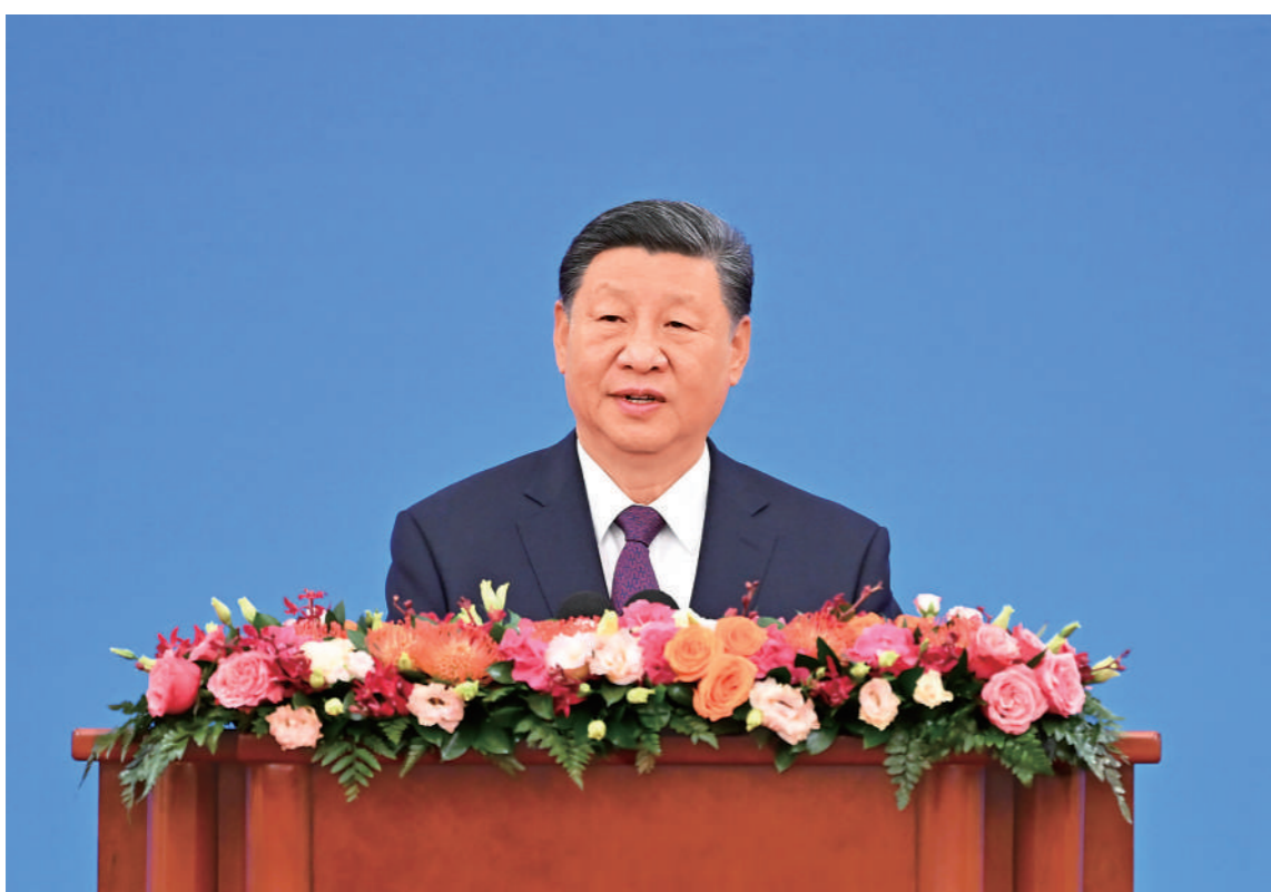
六月二十八日上午,和平共处五项原则发表七十周年纪念大会在北京人民大会堂隆重举行。国家主席习近平出席大会并发表题为《弘扬和平共处五项原则,携手构建人类命运共同体》的重要讲话。