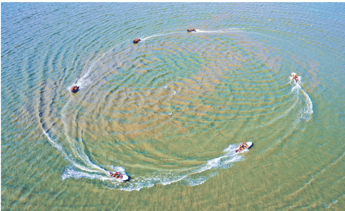
夏日,武警湖北总队某支队开展冲锋舟操作训练。

践行初心使命,勇于攻坚克难。随着政治整训走深走实,该省军区机关干部深入一线聚力解难劲头更足。他们着眼打仗急需、备战急用、官兵急盼的问题迎难而上,主动作为,先后为基层解难题办实事70余件,一批制约战斗力建设的现实难题得到解决,有效激发了官兵投身练兵备战动力。