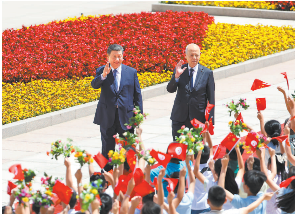
五月三十一日上午,国家主席习近平在北京人民大会堂同来华国事访问并出席中国—阿拉伯国家合作论坛第十届部长级会议开幕式的突尼斯总统赛义德举行会谈。这是会谈前,习近平在人民大会堂东门外广场为赛义德举行欢迎仪式。

新华社北京5月31日电 (记者郑明达、王宾)5月31日上午,国家主席习近平在北京人民大会堂同来华国事访问并出席中国—阿拉伯国家合作论坛第十届部长级会议开幕式的突尼斯总统赛义德举行会谈。两国元首宣布,建立中突战略伙伴关系。 习近平指出,中国和突尼斯是好朋友、好兄弟。建交60年来,无论国际风云如何变幻,中突双方始终相互尊重、平等相待、彼此支持,谱写了发展中国风雨同舟、守望相助的生动篇章。巩固好、发展好中突关系,符合两国人民的根本利益和共同期待。中方愿同突方一道,赓续传统友谊,深化各领域交流合作,推动中突关系迈上新台阶。今天我们宣布建立中突战略伙伴关系,必将开辟两国关系更加美好的未来。 习近平强调,中方支持突方走符合自身国情的发展道路,支持突方独立自主 推进改革进程,将命运牢牢掌握在自己手中。中方愿同突方加强发展战略对接,深化基础设施建设、新能源等领域合作,培育医疗卫生、绿色发展、水资源、农业等领域合作新动能,推动两国高质量共建“一带一路”取得更多成果,欢迎更多突尼斯优质特色产品进入中国市场。中方愿继续向突尼斯派遣高水平医疗队,同突方深化教育、旅游等领域合作,密切人文交流。双方要同“全球南方”国家一道,加强团结协作,践行真正的多边主义,倡导平等有序的世界多极化和普惠包容的经济全球化,实现共同发展。中方愿同突方一道努力,建好中阿合作论坛、中非合作论坛,为中阿关系发展注入新动力,携手构建高水平中非命运共同体。 赛义德表示,很高兴在突中建交60周年之际对中国进行历史性访问并出席中阿合作论坛第十届部长级会议开幕式。突中两国友谊深厚、理念相通,各领域合作成果丰硕。突方期待在国家发展进程中得到中方更多支持,密切卫生、交通、绿色发展、教育等领域合作,将中突关系提升到新水平。突方坚定奉行一个中国政策,坚定支持中国政府为实现国家统一和捍卫核心利益所作努力。突方和阿拉伯国家赞赏中华优秀传统文化理念,赞赏中方在国际事务中主持公道正义。每一个国家都有权自主选择符合自身国情的发展道路。突方愿同中方秉持全人类共同价值,密切团结协作,反对霸权主义和阵营对抗,创造更加平等美好的世界,让世界人民能够享受真正的人权和自由,和谐共存,共享和平、安全与繁荣。 双方还就巴以冲突交换意见。习近平强调,中方同阿拉伯国家立场高度契合,愿同突尼斯等广大阿拉伯国家一道,推动巴勒斯坦问题在落实“两国方案”基础上得到全面、公正、持久解决。 (下转第二版)