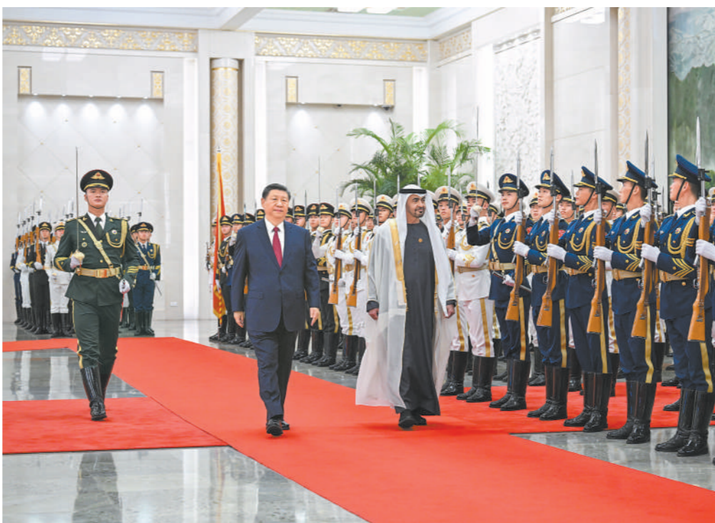
5月30日下午,国家主席习近平在北京人民大会堂同来华国事访问并出席中国—阿拉伯国家合作论坛第十届部长级会议开幕式的阿联酋总统穆罕默德举行会谈。这是会谈前,习近平在人民大会堂北大厅为穆罕默德举行欢迎仪式。