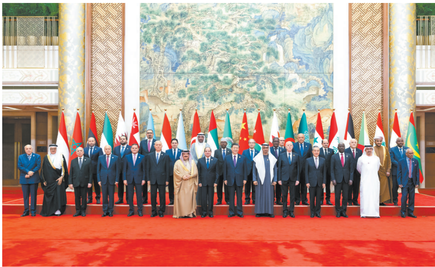
5月30日上午,国家主席习近平在北京钓鱼台国宾馆出席中阿合作论坛第十届部长级会议开幕式并发表主旨讲话。这是习近平同巴林国王哈马德、埃及总统塞西、突尼斯总统赛义德、阿联酋总统穆罕默德、阿盟秘书长盖特以及22位阿拉伯国家代表团团长集体合影。