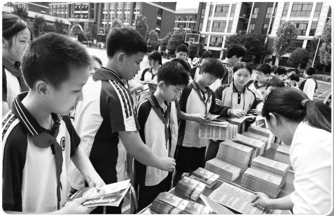
湖南省常德市国防动员办公室在尚宇中学开展防空防灾知识宣传。

在新的工作格局下，如何进一步推动国防动员建设高质量发展，各地纷纷作出探索创新。本期，我们关注一组军地合力同下“一盘棋”，同唱“一台戏”，从不同层面、以不同方式推动国防动员工作的做法。