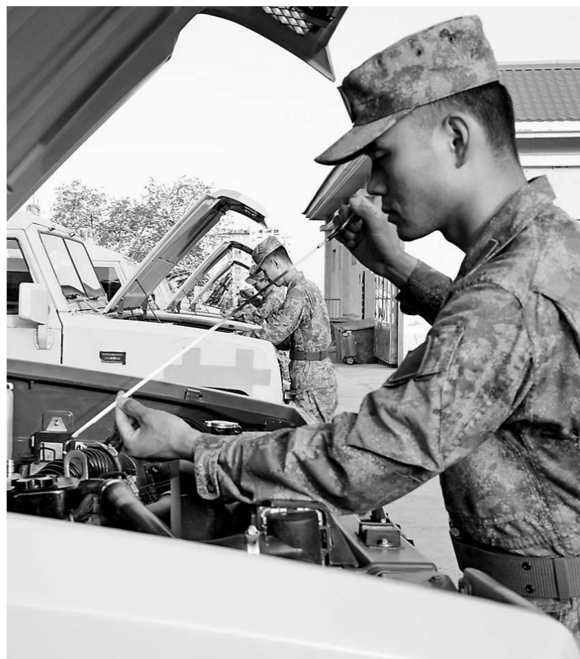
近日,某部依法依规开展装备维护保养工作,强化官兵爱装管装意识。