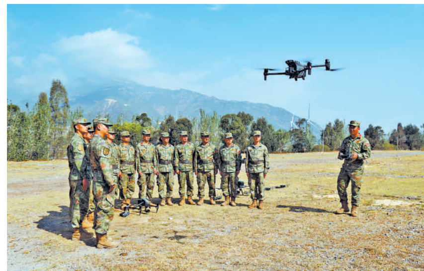
近日，四川省凉山军分区组织所属人员开展野外驻训。图为参训人员进行无人机操作练习。

助。李伟军因病不能从事重体力劳动，家中15亩土地往年都以相对便宜的价格租给他人耕种。今年，村民兵连长郝运才主动找到他，向他详细讲解镇里“保耕、代耕”行动初衷和帮助他们耕种玉米的意愿，并针对地块特征推荐抗倒伏玉米品种。在村民兵骨干的帮助下，李伟军家旱田很快完成翻土、播种、施肥全流程种植作业。郝运才拍着胸脯说：“您放心，我们管到底，秋收时我们再来，中间有啥事招呼一声就行！” 该市人武部领导告诉记者，2022年，吉林长春国家农业高新技术产业示范区在公主岭市揭牌，总面积139.39平方公里，是吉林省主要的粮食产区之一。今年春耕以来，该市人武部组建多支民兵助农分队，为有困难的群众提供配送农资、耕地播种、农技指导等服务，护航春耕备耕。他们先后组织大型农机设备28台，发动民兵64人，对域内军人军属、缺乏劳动力家庭共计415户提供“托管代耕”服务，总代耕面积超过9000亩，辐射域内11个行政村。 刚完成播种作业的沈树丰抹了一把汗，骄傲地说：“作为黑土地上的民兵，我们要保护好黑土地，奉献黑土地，为国家粮食安全作出应有贡献。” 左上图： 吉林省公主岭市民兵助农分队整装待发。