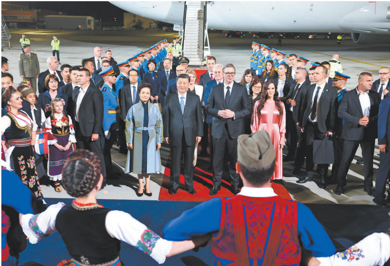
当地时间5月7日晚,国家主席习近平乘专机抵达贝尔格莱德,应塞尔维亚总统武契奇邀请,对塞尔维亚进行国事访问。习近平乘坐专机抵达贝尔格莱德尼古拉·特斯拉国际机场时,塞尔维亚总统武契奇夫妇,对华合作国家委员会主席、前总统尼科利奇夫妇,议长布尔纳比奇,总理武切维奇和外长久里奇等热情迎接。

以来,双边关系实现跨越式发展,取得历史性成就。两国政治互信坚如磐石,高质量共建“一带一路”成果丰硕,人员往来更加密切,铁杆友谊深入人心。中塞合作建立在平等互利基础上,符合两国根本利益和长远利益。中方愿同塞方一道,不忘初心,携手前行,开创新更强、领域更广、质量更高的合作新局面。我期待以这次访问为契机,同武契奇总统就双边关系以及其他共同关心的问题深入交换意见。(下转第三版)