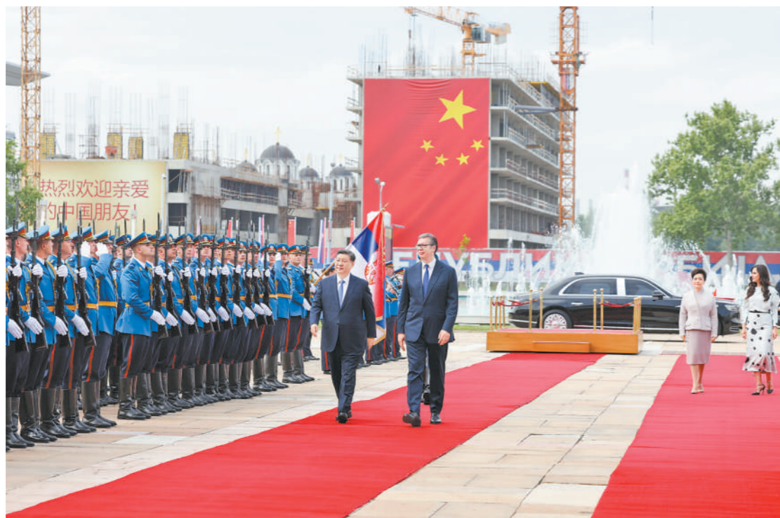
当地时间5月8日上午,国家主席习近平在贝尔格莱德塞尔维亚大厦同塞尔维亚总统武契奇举行会谈。这是会谈前,武契奇为习近平举行隆重欢迎仪式。