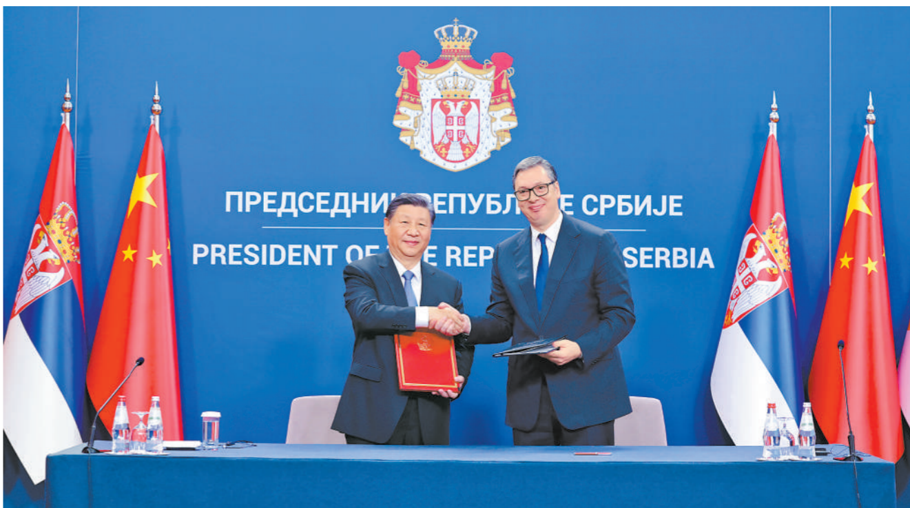
当地时间5月8日上午,国家主席习近平在贝尔格莱德塞尔维亚大厦同塞尔维亚总统武契奇举行会谈。会谈后,两国元首共同签署《关于深化和提升中塞全面战略伙伴关系、构建新时代中塞命运共同体的联合声明》。