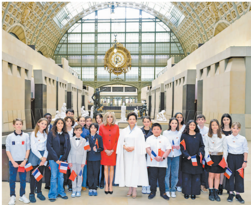
当地时间5月6日下午,国家主席习近平夫人彭丽媛在巴黎应邀同法国总统马克龙夫人布丽吉特共同参观奥赛博物馆。