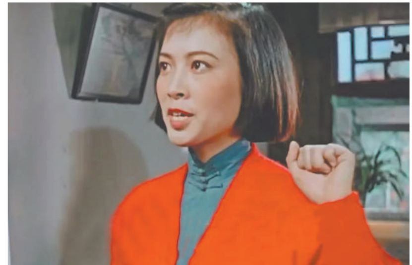
电影《青春之歌》中林道静入党的场景。