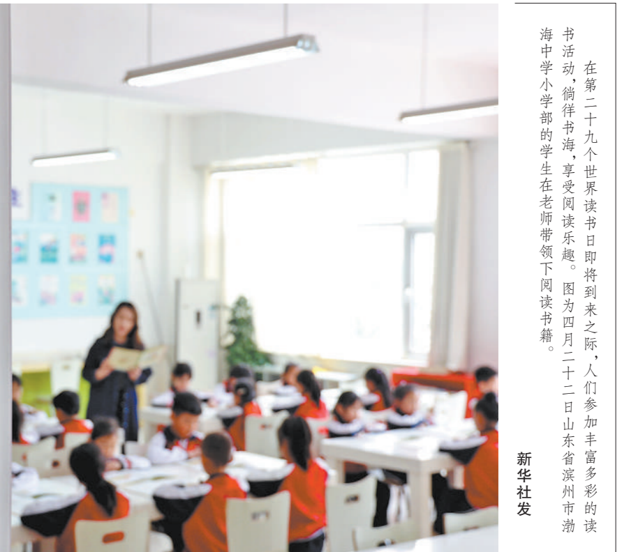
在第二十九个世界读书日即将到来之际,人们参加丰富多彩的读书活动,徜徉书海,享受阅读乐趣。图为四月二十二日山东省滨州市渤海小学的学生在老师带领下阅读书籍。