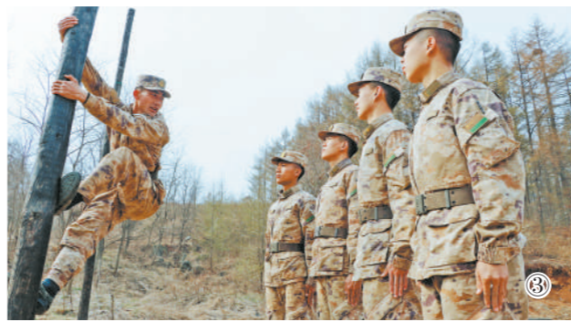
图①:第79集团军某旅某连出动执行通联保障任务;图②:电台学习训练;图③:攀登固定训练。