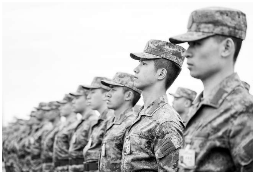
4月1日，第72集团军2024年春季入伍新兵开启新生活。

头举办“军营开放日”、双拥文艺汇演…… 服务家属就是服务官兵，就是服务战斗力。该旅政治工作部领导介绍，该旅将继续推进家属委员会建设，充分发挥家属委员会服务家属和部队建设的职能。