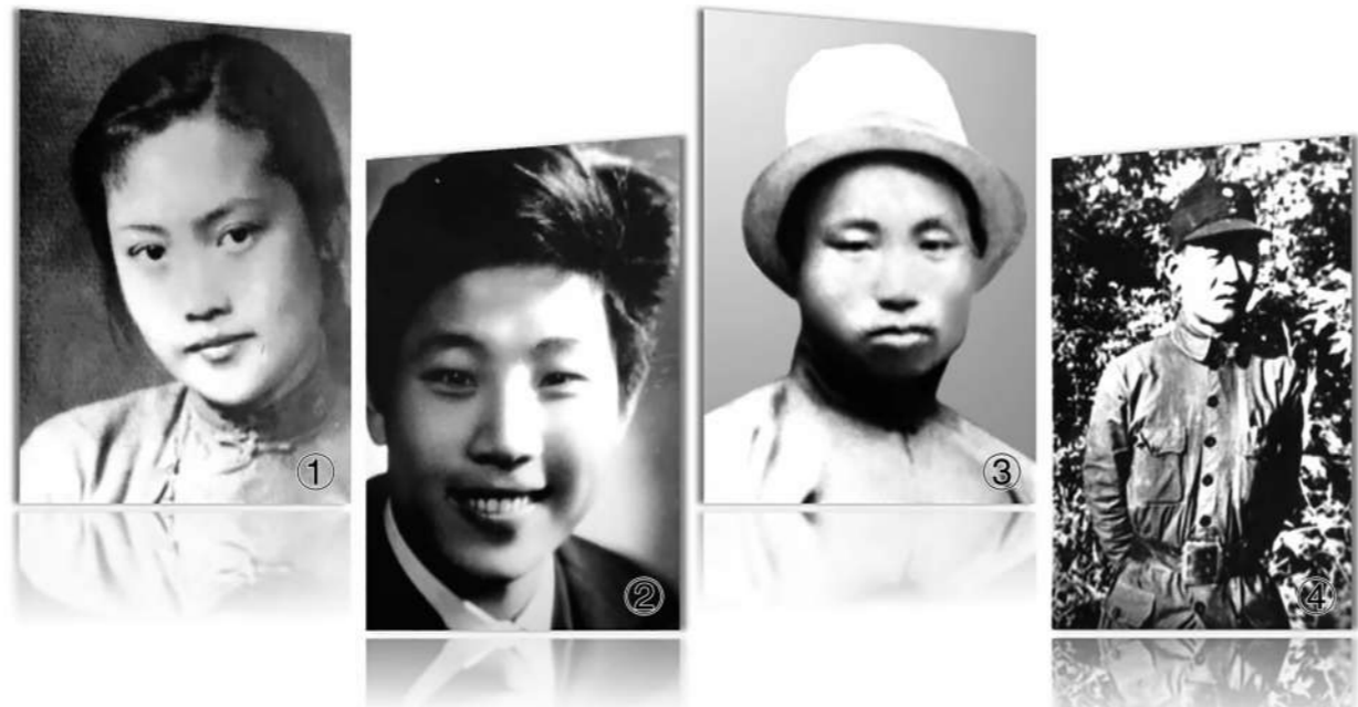
图①：王海纹烈士；图②：李增援烈士；图③：郭猛烈士；图④：陈发鸿烈士。