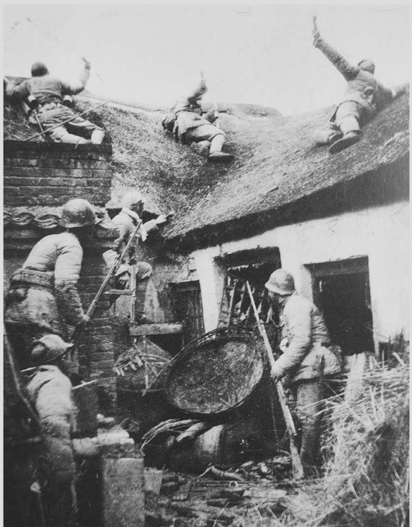
1948年3月，周村战斗中，我军在房顶上与敌人激战。