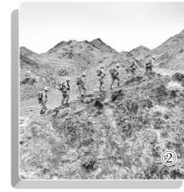
图②：该连执勤分队踏上巡逻路。