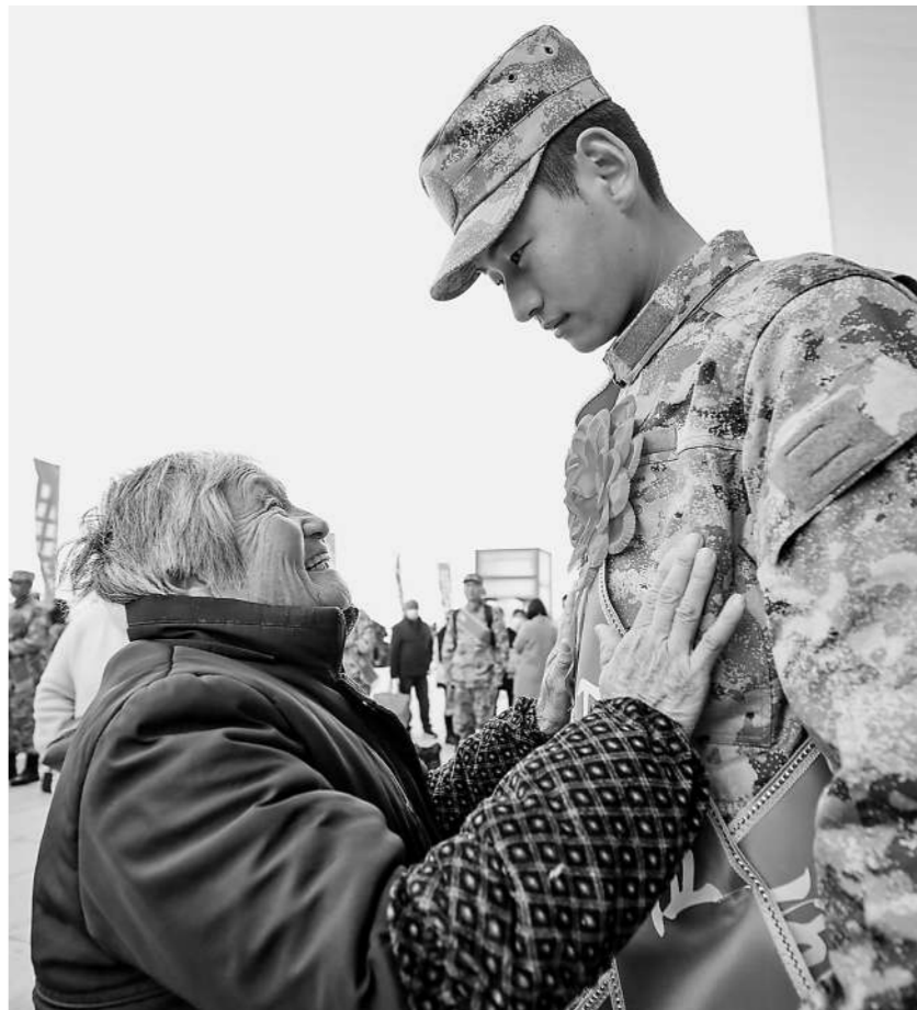
3月19日，江苏省淮安市即将奔赴军营的新兵与家人道别。

（文字整理：王梦缘、彭金磊） 制图：唐硕