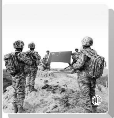
图①：新疆伊吾县人武部生产连官兵在“伊吾四十天保卫战”旧址前宣誓。