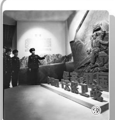
图③：该连官兵在伊吾县烈士陵园纪念馆学习英烈事迹。