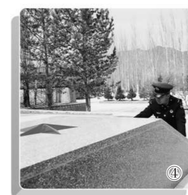
图④：该连组织新战士来到伊吾县烈士陵园开展祭扫活动。