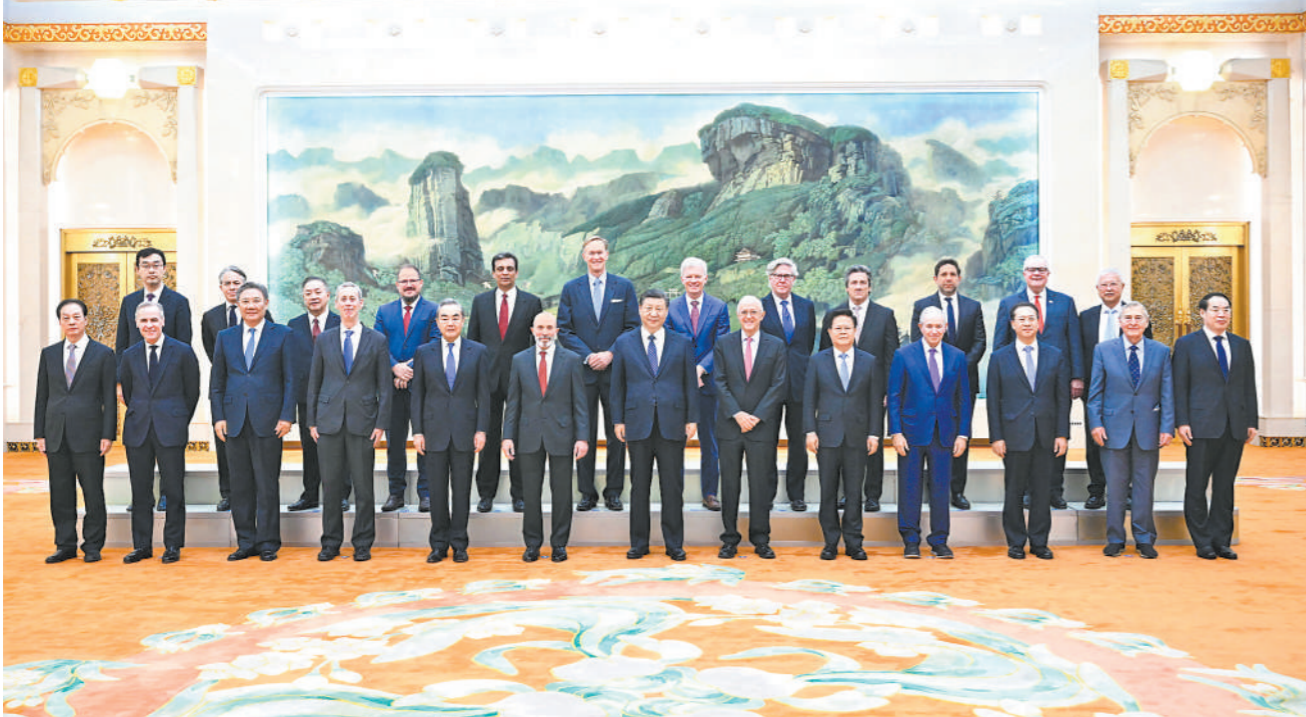
3月27日，国家主席习近平在北京人民大会堂会见美国工商界和战略学术界代表。

●中美关系是世界上最重要的双边关系之一。中美两国是合作还是对抗，事关两国人民福祉和人类前途命运。中美各自的成功是彼此的机遇。只要双方都把对方视为伙伴，相互尊重、和平共处、合作共赢，中美关系就会好起来。今年是中美建交45周年。中美关系史是一部两国人民友好交往的历史，过去靠人民书写，未来更要靠人民创造。中国有句话，从善如登，从恶如崩。希望两国各界人士多来往、多交流，不断积累共识，增进信任，排除各种干扰，深化互利合作，为两国人民带来更多实实在在的福祉，为世界注入更多稳定性。 ●中国经济是健康、可持续的。去年中国经济增速在世界主要经济体中名列前茅，对世界经济增长贡献率继续超过30%，这是中国人民干出来的，也离不开国际合作。中国的发展历经各种困难挑战才走到今天，过去没有因为“中国崩溃论”而崩溃，现在也不会因为“中国见顶论”而见顶。我们将持续推动高质量发展，持续推进中国式现代化，既让中国人民不断过上更好生活，也为世界可持续发展作出更大贡献。中国发展前景是光明的，我们有这个底气和信心。 ●我多次讲过，改革开放是当代中国大踏步赶上时代的重要法宝。中国的改革不会停顿，开放不会止步。我们正在谋划和实施一系列全面深化改革重大举措，持续建设市场化、法治化、国际化一流营商环境，为包括美国企业在内的各国企业提供更广阔发展空间。面对中美经贸关系近年来出现的新情况新变化，双方要坚持相互尊重、互惠互利、平等协商，按经济规律和市场规则办事，扩大和深化经贸互利合作，尊重彼此的发展权利，追求中美共赢和世界共赢。欢迎美国企业更多参与共建“一带一路”，参加中国国际进口博览会等大型经贸活动，继续投资中国、深耕中国、赢在中国。 ●这几年，中美关系经历了不少波折，也遭遇过严峻挑战，其中的教训值得吸取。中美关系回不到过去，但能够有一个更好的未来。去年我同拜登总统在旧金山会晤，最大的共识就是中美关系应该稳下来、好起来。过去几个月，双方团队围绕我和拜登总统达成的共识，在政治外交、经贸财金、执法禁毒、气候变化、人文交流等各领域保持沟通，取得了进展。当前形势下，中美的共同利益不是减少了，而是更多了。不管是经贸、农业等传统领域，还是气候变化、人工智能等新兴领域，中美应该成为对方发展的助力，而不应该成为阻力。推动世界经济复苏、解决国际和地区热点问题，都需要中美协调合作，展现大国胸怀，拿出大国担当。美方应同中方相向而行，树立正确战略认知，妥善处理敏感问题，保持中美关系止跌企稳的势头，积极探索正确相处之道，推动中美关系持续稳定健康向前发展。