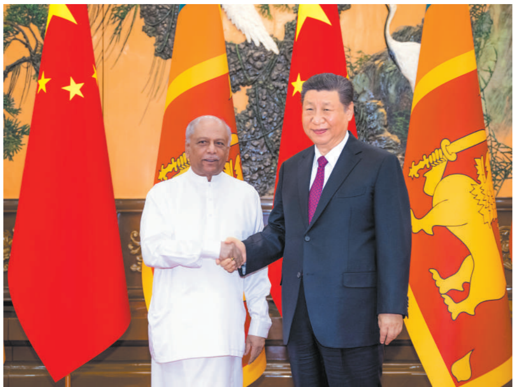
3月27日下午，国家主席习近平在北京人民大会堂会见来华进行正式访问的斯里兰卡总理古纳瓦德纳。

新华社北京3月27日电（记者郑明达）3月27日下午，国家主席习近平在北京人民大会堂会见来华进行正式访问的斯里兰卡总理古纳瓦德纳。 习近平指出，中斯友好源远流长，两国人民有着天然的亲近感。巩固好、发展好中斯关系，符合两国人民的根本利益和共同期待。中方愿同斯方一道，继续弘扬“独立自主、团结互助”的《米胶协定》精神，巩固政治互信，加强治国理政经验交流，拓展务实合作，高质量共建“一带一路”，不断深化中斯真诚互助、世代友好的战略合作伙伴关系。 习近平强调，中方坚定支持斯里兰卡维护国家主权、独立、民