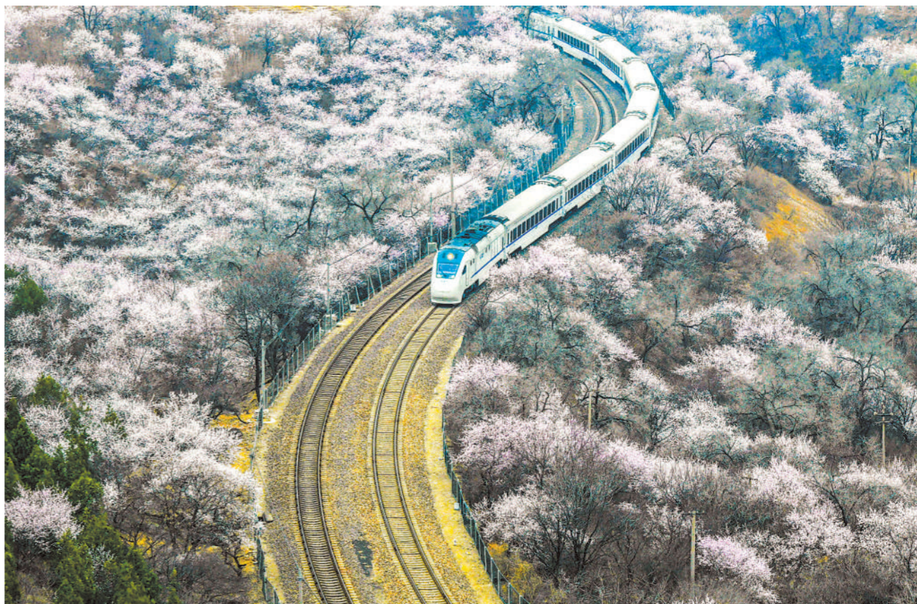
近日，北京市居庸关长城景区山桃花开，花海中的列车、长城上的游客与春景，勾勒出一幅美丽的画卷。图为 3 月 24 日一列客运行列车行驶在北京市居庸关长城脚下的花海中。