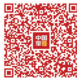
扫二维码观看纪录片《超级装备》精彩片花