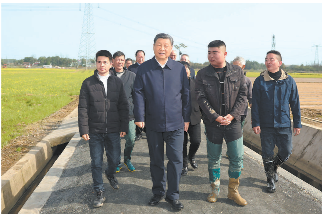
3月18日至21日,中共中央总书记、国家主席、中央军委主席习近平在湖南考察。这是19日下午,习近平在常德市鼎城区谢家铺镇港中坪村,同种粮大户、农技人员、基层干部亲切交流。