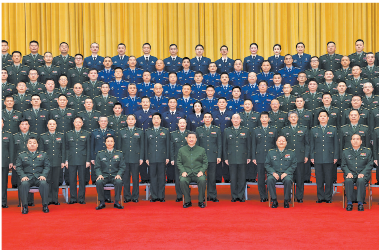
3月18日至21日,中共中央总书记、国家主席、中央军委主席习近平在湖南考察。这是20日上午,习近平在长沙亲切接见驻长沙部队上校以上领导干部,代表党中央和中央军委向驻长沙部队全体官兵致以诚挚问候。本报记者 范显海摄

志向,努力成为堪当强国建设、民族复兴大任的栋梁之材。 随后,习近平来到巴斯夫杉杉电池材料有限公司考察。这是一家主营锂离子电池正极材料研发、生产和销售的中德合资企业。习近平听取当地加快发展新质生产力、扩大高水平对外开放等情况介绍,察看企业产品展示,了解材料性能测试情况和电池生产流程。他强调,科技创新、高质量发展是企业不断成长壮大、立于不败之地的关键所在,民营企业、合资企业在这方面都可以大有作为。中国开放的大门会越开越大,我们愿意同世界各国加强交流合作,欢迎更多外国企业来华投资发展。 19日,习近平到常德市考察调研。位于沅江江畔的常德河街历史悠久,曾毁于1943年的常德战役。近年来,常德市复原老河街风貌,将此地打造成为历史文化街区。当天上午,习近平来到常德河街,察看各种特色小吃、特产、特色工艺品,同店主和游客亲切交流,并欣赏非物质文化遗产技艺展示,详细了解常德老城街道修复利用、城市规划、水环境综合治理等情况。习近平指出,多姿多彩的地方特色传统文化,共同构成璀璨的中华文明,也助推经济社会发展。常德是有文化传承的地方,这里的丝弦、高腔、号子等要以适当载体传承好利用好,与时俱进发展好。 湖南是全国13个粮食主产省之一,水稻播种面积、总产量