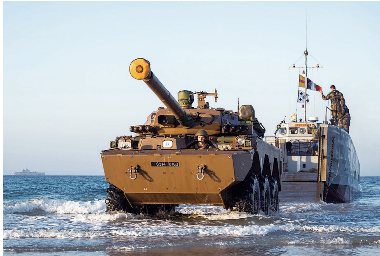
欧洲多国举行联合军事演习，检验欧盟部队两栖登陆能力。

特朗普“以军费划线定亲疏”的讲话，对欧洲各国的心理冲击很大，并引起强烈反应。德国总理朔尔茨和总统施泰因迈尔都强调，任何否认北约绝对保护承诺的说法，都是不负责任和危险的，而且只符合俄罗斯的利益，不能允许任何人拿欧洲的安全做赌注。即便