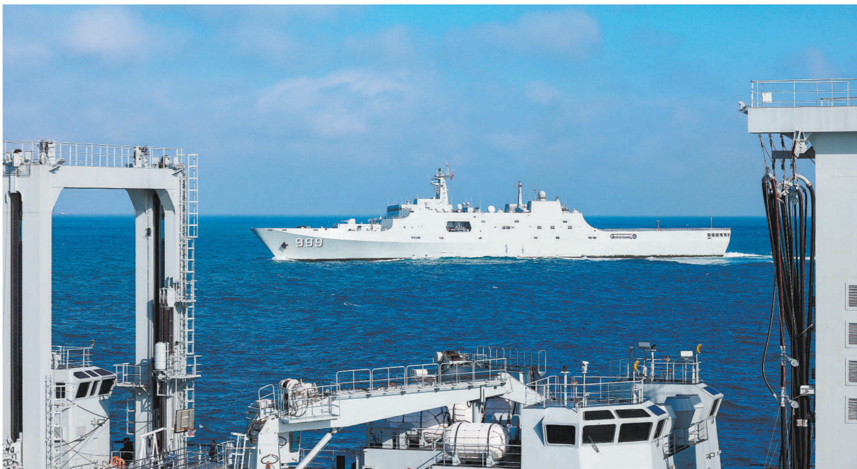
近日，海军某支队组织舰艇编队开展实战化训练。

典型鼓舞斗志，榜样催人奋进。连日来，该团广泛开展群众性练兵比武活动，在先进典型事迹激励下，官兵克服不利天气影响，奋勇拼搏、挑战极限，刷新多项训练纪录。